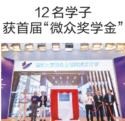
深大微众金融科技学院成立一周年，金融科技实验室揭牌

羊城晚报讯 记者沈婷婷、通讯员廖广文报道：11月24日，深圳大学微众银行金融科技学院（以下简称“深大微众金融科技学院”）一周年庆典暨2020届开学典礼举行，深圳大学微众金融科技实验室现场揭牌。活动中，学院还举行了2019—2020年度首届“微众奖学金”颁奖仪式，12名学子获此殊荣，21位来自企业的专家获聘学院“业界导师”。