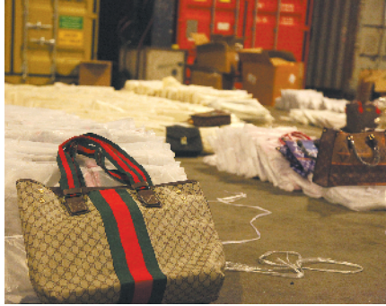
大鹏海关查获的涉嫌侵权产品

海关提醒，海淘商品中的发票与国内税务发票不同，发票格式比较随意，无固定样式，国外发票也无法到税务部门核查。同时购物小票和银联签购单可以使用收银系统和刷卡机伪造，伪造的成本及技术难度都不大，切勿简单以票据辨真伪。