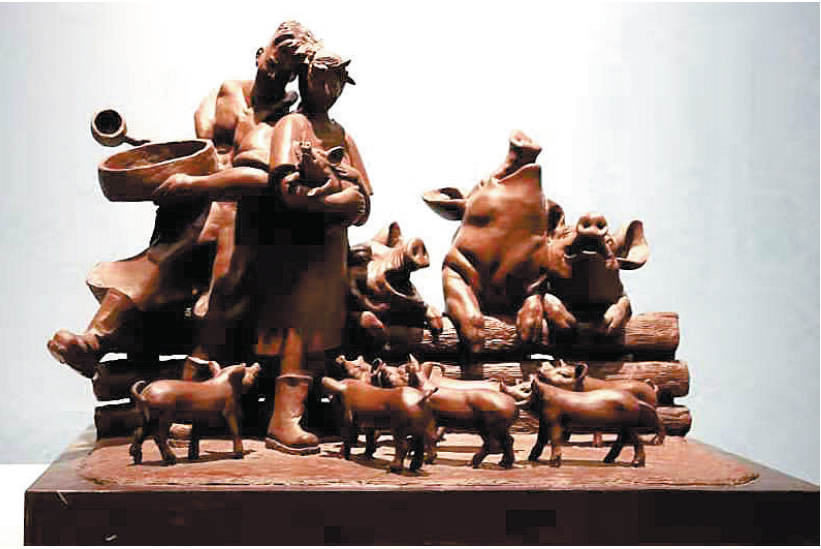
开饭啦（青铜作品） □何健君

偶遇以前的邻居夫妻，正在嘘寒问暖之际，一个漂漂亮亮的姑娘走过来，挽起女邻居的手，笑颜如花。女邻居介绍说：“我女儿。” 他们搬家也就六七年时间吧，那个长得像洋娃娃一样的小女孩，已亭亭玉立了。女邻居说，她小时候喜欢唱歌，还是学校合唱团的领唱。去年她对美术感兴趣了，说以后要到国外去深造。她自己报的美术班，每周三节课，老师说她学得很好。 想起与他们同住一个单元楼的时候，几乎每天清晨，就会听到小姑娘“呼天喊地”地哭，那稚嫩的声音常常把我这个夜猫子从睡梦中惊醒。 “我不要去幼儿园，就不去。求求你们，让我在家好吗！” 听着听着，我就想笑，一笑，睡意就没了。 记得有一次，小女孩的妈妈一个人拖她出门，她哭着喊着，就是赖着不走。小女孩妈妈想把她抱起来，她就挣扎，双腿乱蹬，搞得狼狈不堪。 我就帮着抱起她，一口气抱到楼下。就这一遭，小女孩对我很有意见，后来一见我，就把小脑袋扭到一边，嘟起小嘴巴。她爸爸妈妈让她叫“叔叔”，她总是不情愿地咕哝一句“叔叔”。 一想起她小时候的样子，我又想笑了。