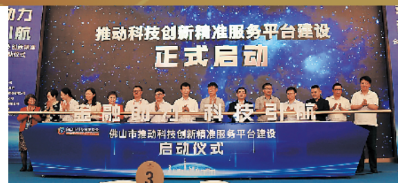
兴业银行佛山分行参加由佛山市科技金融协会组织的推动科技创新精准服务平台建设启动仪式

面对防控新冠肺炎疫情的严峻形势，广东省、佛山市金融监管机构积极支持企业复工复产，相继出台了一系列措施稳定企业预期与信心。兴业银行佛山分行立足于自身的优势，提出将稳定产业链供应链作为工作重心之一，以“兴享应收”线上供应链金融平台为重要抓手，为供应商提供融资服务，无需核实供应商实力，无需供应商提供担保，有效解决供应商融资难、融资贵和融资慢的问题，成功营造银行、核心