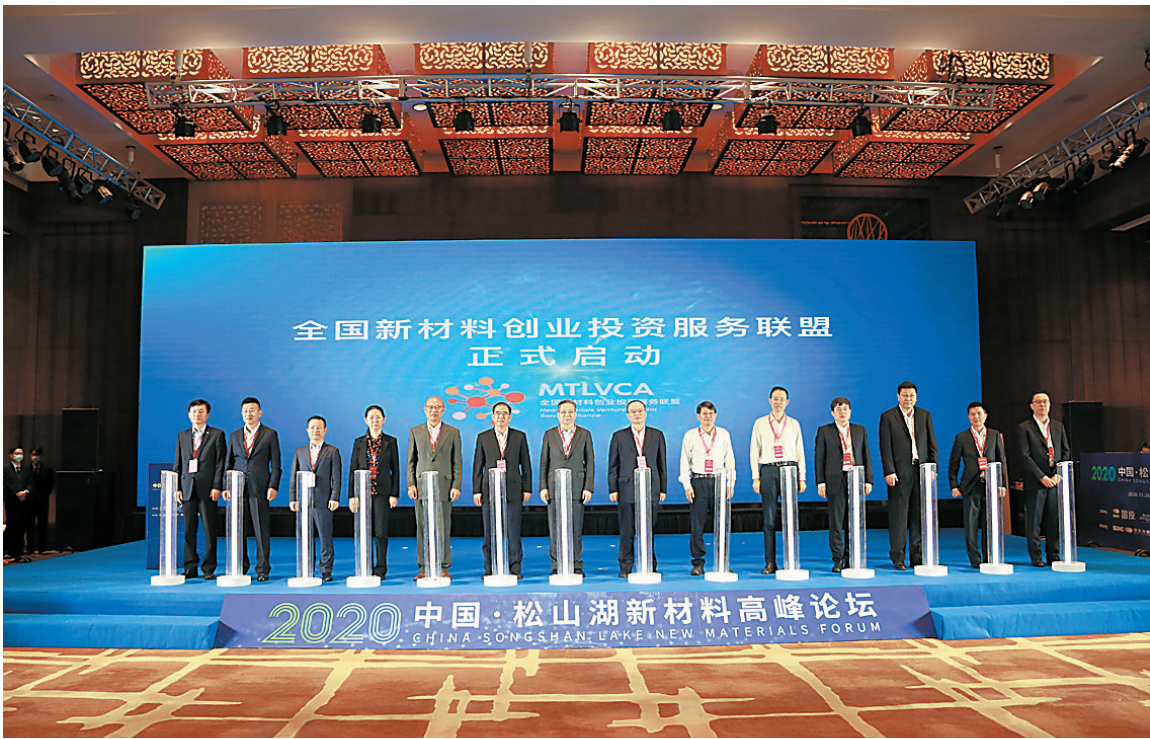
全国新材料创业投资服务联盟启动

签约仪式。该基金重点面向松山湖材料实验室,以及东莞乃至大湾区重要项目。未来主要投资前沿新材料及相关领域,助力解决基础研究产业化落地的转化瓶颈,通过基金投资引导,加速有前景的新产品、新技术产业化落地。全国新材料创业投资服务联盟也同步启动。