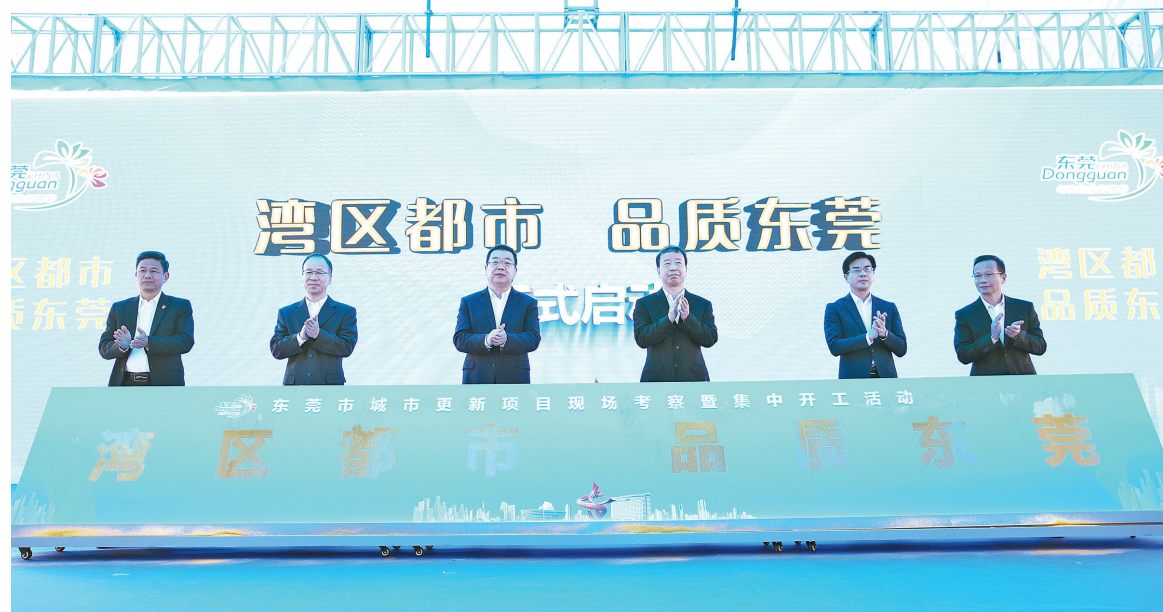
12月1日，东莞市城市更新项目现场考察暨集中开工活动在虎门北栅社区举行

利社区招商创智新城项目，项目面积共约1100亩，预计总投资达80亿元，达产后年产值可达150亿元，年税收约14亿元。本次开工活动集中展示了今年以来城市更新项目开工情况，目前全市同步在拆、在建的城市更新项目有189个，预计总投资额达1561亿元，今年已投入资金达411亿元。 开工活动上，市自然资源局、市金融工作局、城市更新协会以及相关金融机构联合发布了《东莞城市更新金融产品手册》，向市场推送了城市更新的一系列金融创新产品。据了解，近日市自然资源局与市金融工作局建立了城市更新金融服务联席会议制度，为政府部门、行业协会、开发主体和金融机构的对接、交流搭建服务平台。 肖亚非表示，“十四五”时期是东莞抢抓“三区”叠加、“双循环”新发展格局构建等重大历史机遇，实现城市能级突破跃升的黄金时期。全市各镇街、各园区、各有关部门要站在对城市未来发展负责的高度，突出“产