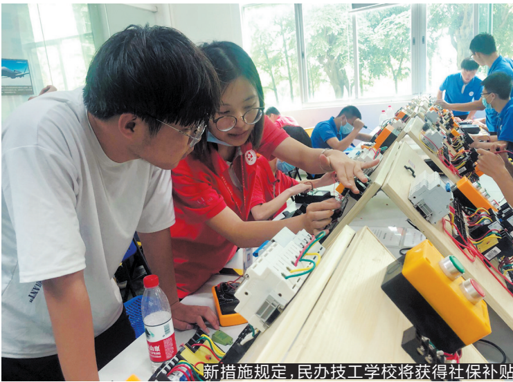
新措施规定,民办技工学校将获得社保补贴

记者从珠海市人力资源和社会保障局获悉,珠海市人力资源和社会保障局、市财政局日前联合出台了《关于进一步规范和优化就业创业补助资金使用管理的通知》(以下简称《通知》)。《通知》对珠海市就业创业补贴项目进行了优化,对资金的使用管理进行了规范,对申请流程进行了简化。《通知》的奖补力度更大、覆盖范围更广、政策项目更全、含金量更高,是进一步强化社会民生福祉、推动实现更高质量就业的一个重大举措。