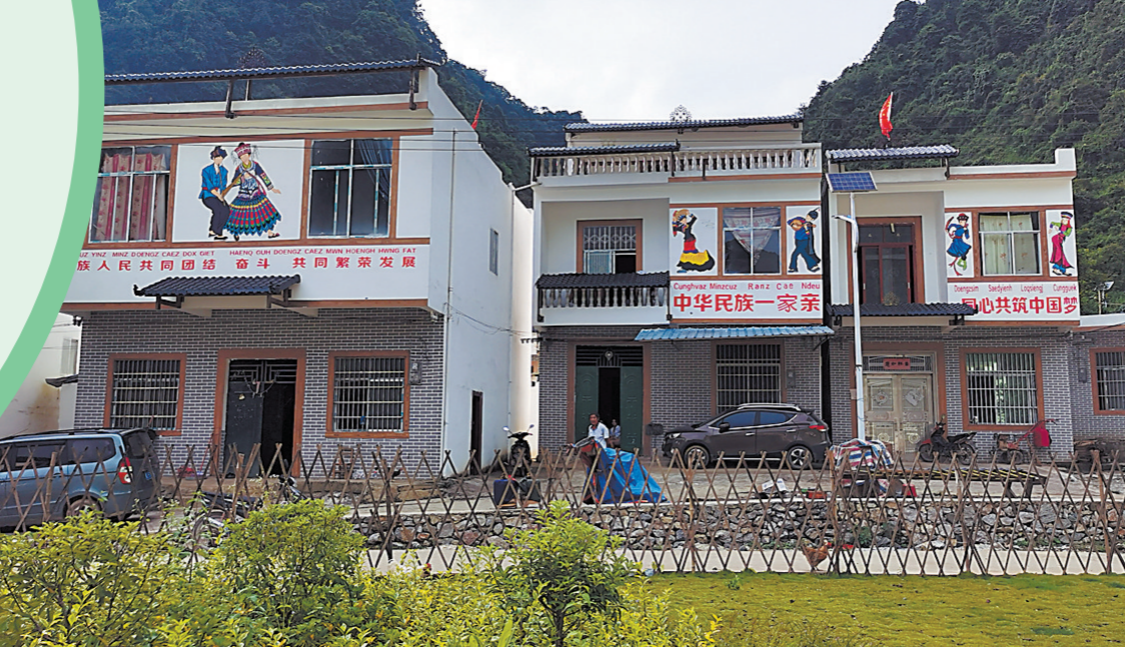
通过危房改造,大莫村村民住上了新居

通过实施兴边富民“五个工程”,边境贫困地区的生产生活条件、乡村面貌发生了质的飞跃。目前,靖西市、那坡县已基本实现“两不愁三保障”,“村村有路通、人人有水喝、户户有房住、孩子有学上、看病有保障”,城乡面貌焕然一新。