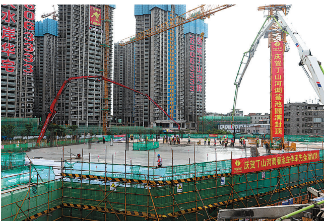
丁山河调蓄池顺利封顶