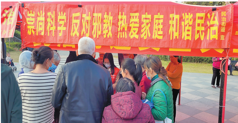
借力国家宪法日开展禁毒、反邪宣传