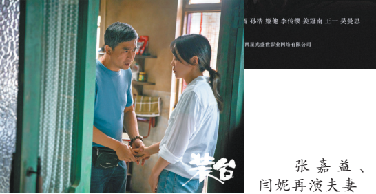
张嘉益、闫妮再演夫妻