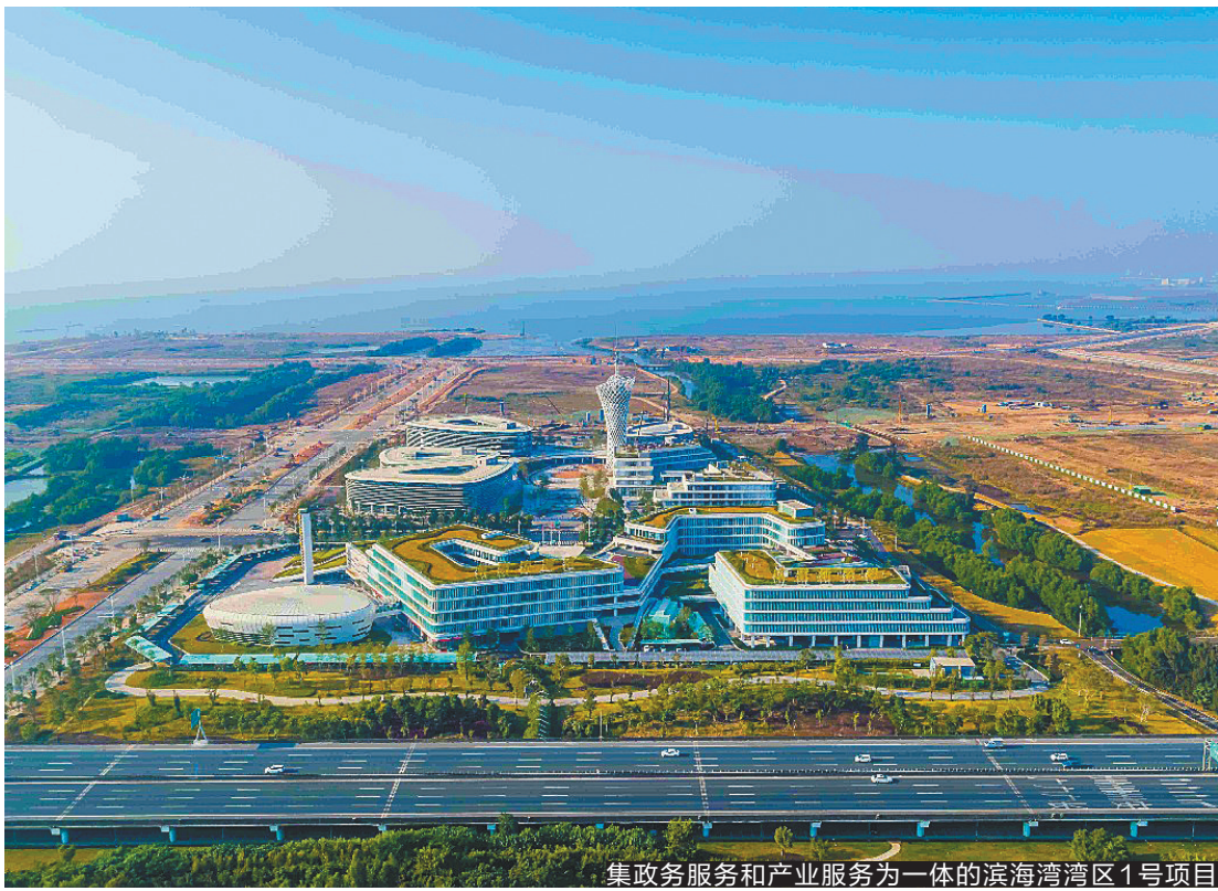
集政务服务和服务为一体的滨海湾新区1号项目

亿元,滨海湾新区并不需要从头开始。这让东莞加速融入大湾区,有了更好的起点。而滨海湾新区也有着高起点——对标深圳湾。处在珠三角黄金中轴位置的滨海湾新区,东莞市委市政府的重视自不必说,对于广州的南沙和深圳的空港的发展也是相当重要,该新区的成功可以促进入深圳西部、广州南部区域共同发展。