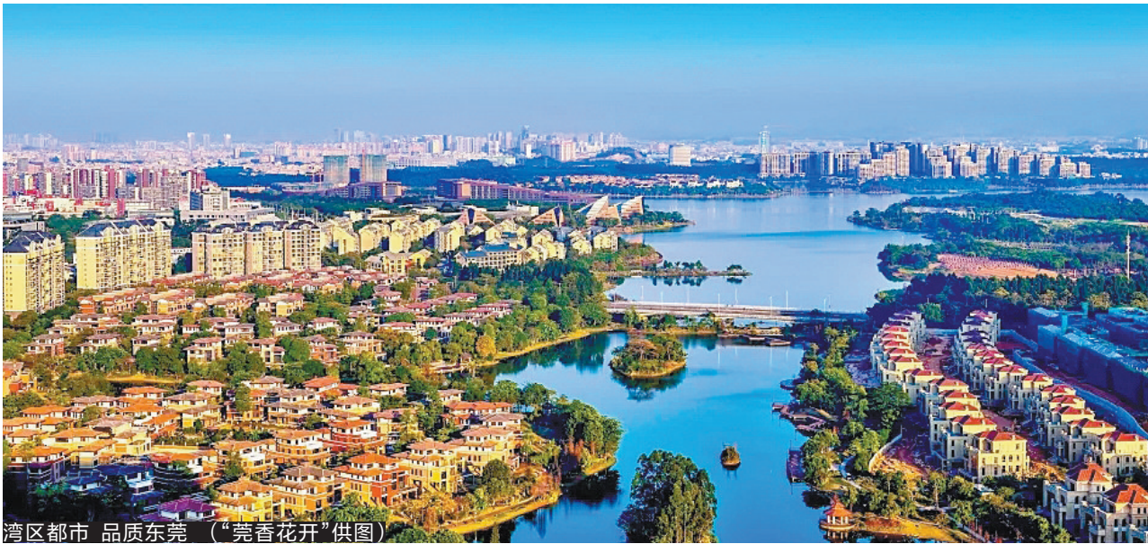
湾区都市 品质东莞

2019年年初,东莞提出“湾区都市、品质东莞”的战略任务和价值追求,在国际一流湾区和世界级城市群的蓝图里,一幅幅宜居宜业的高品质现代都市画卷正在绘就。 近两年来,东莞举全市之力推进实施“六大工程”,实现了良好开局。