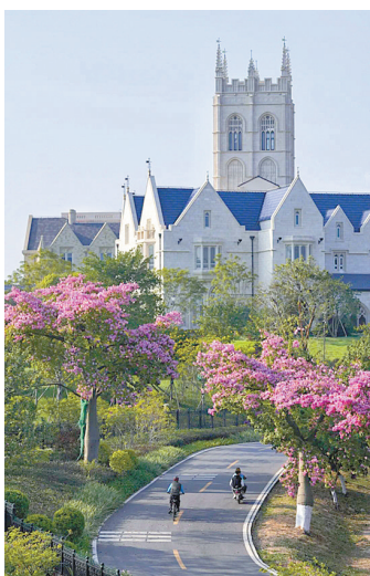
华为小镇地处美丽松山湖

水污染治理攻坚战以来,东莞实施“五大组合拳”加“三大保障措施”。五大组合拳包括实现全市污水管网“一系统、一张网”管理格局;破除以往“镇街各自为政、职能部门单打独斗”的污染防治攻坚局面;建立并完善市级—流域—镇级指挥体系;以大兵团作战方式开展茅洲河、石马河、东引运河、东江下游片区4大重点流域综合治理;全市污水治理工程项目数超过600个,项目总概算约712亿元。