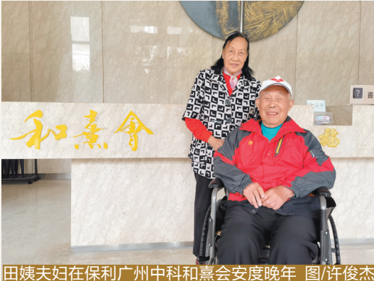
田姨夫妇在保利广州中科和嘉会安度晚年

她仅为兴趣忙碌，忙得充实轻松欣喜。或大或小的变化凝聚成老人的成就感，和嘉会的工作人员笑称，田阿姨比他们还忙。“以前我以为来养老院就是走人生最后一程，是无奈凄苦的；现在我才意识到，人老了需要专业团队照料，就像小孩子应该去幼儿园，老人就应该到养老院，这是顺理成章的事情。”田姨也常对看望他们的老战友们这样说。她笑着结束了和记者的聊天，上楼参加当天关于老年人心理的“和嘉讲堂”去了。