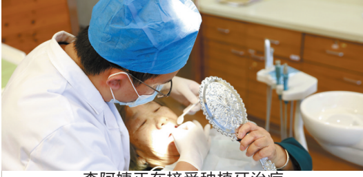
李阿姨正在接受种植牙治疗