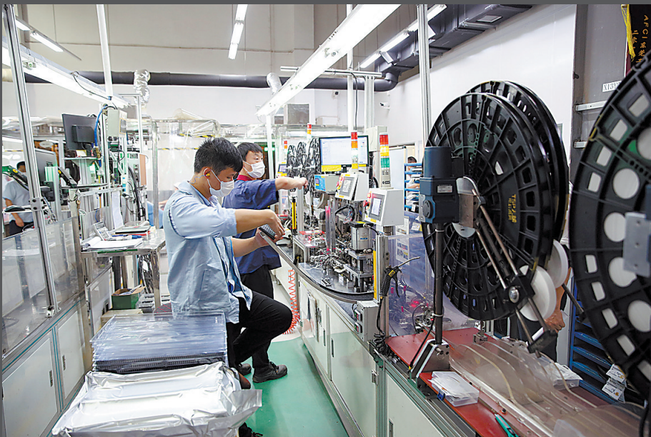
制造企业有序生产

目前,“企莞家”平台注册企业超过28000家,已形成了一套相对完善的功能模块,一套相对成熟的工作机制、一支专业化的服务队伍,成为全市制造业企业普遍熟悉和认可的对企服务平台,尤其是在今年疫情条件下作用凸显。