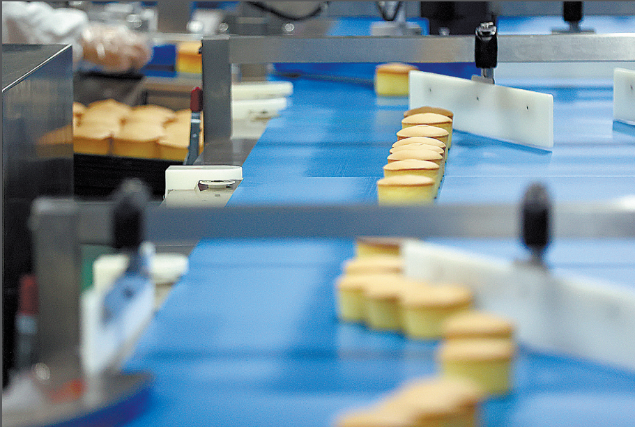
智能十足的生产线