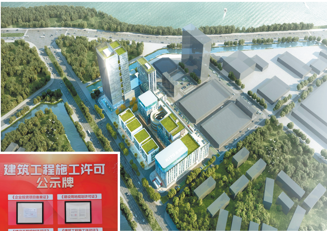
▲金意陶总部绿色家居产业园建成效果图

“签订土地出让合同后，一个小时内，工业项目便实现了四证齐全。”12月15日，佛山市禅城区“拿地即开工”改革试点项目举办动工仪式，道氏氢能及新材料产业园、金意陶总部绿色家居产业园两个投资均在10亿元以上的产业项目，在禅城区南庄镇破土动工，创造了禅城区工程建设项目审批制度改革实施以来的最快审批速度，实现了“拿地即开工”的改革目标。此外，国星光电项目、佛山四中附属学校项目也在当天同步举办动工仪式。