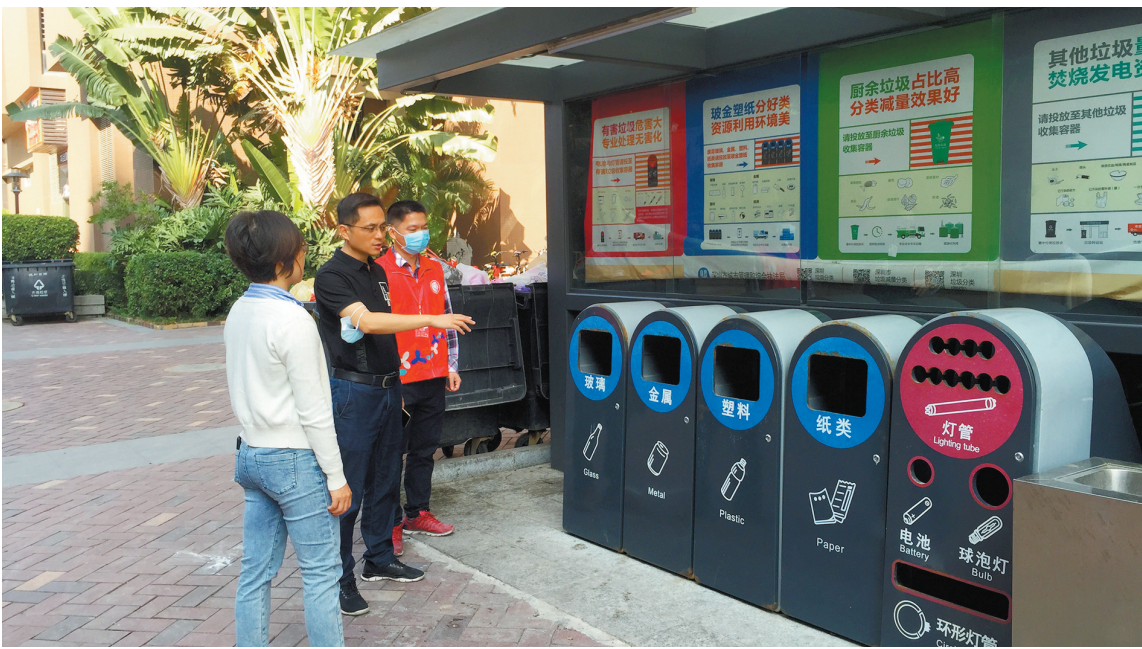
新牛社区垃圾分类工作高效展开