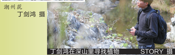
丁剑鸿在深山里寻找植物 STORY 摄