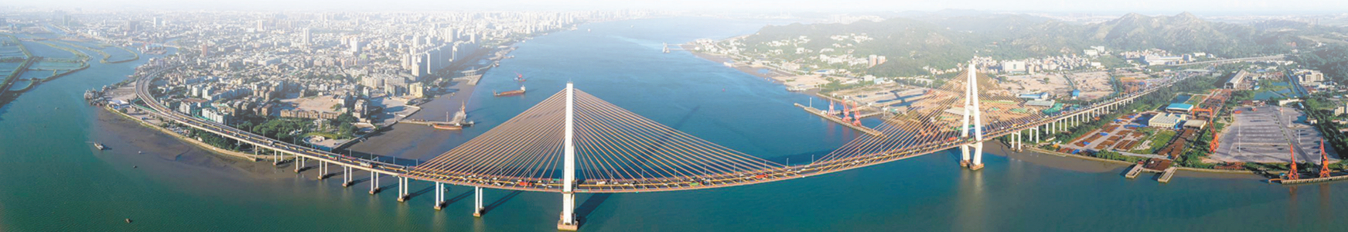
汕头一湾两岸风光如画 陈忠 摄

在当天的活动中，主办方还举办了“创业中华·‘十四五’中国发展与华侨华人投资创业峰会”主题论坛及签约仪式、授牌仪式。此外，中国侨商联合会和汕头华侨经济文化合作试验区管理委员会在当天签订了合作协议。“南粤侨创会成立揭牌暨侨界创新创业成果展启动仪式”“中国华侨国际文化交流基地授牌仪式”及“南粤侨创基地(汕头)授牌仪式”也于当天进行。