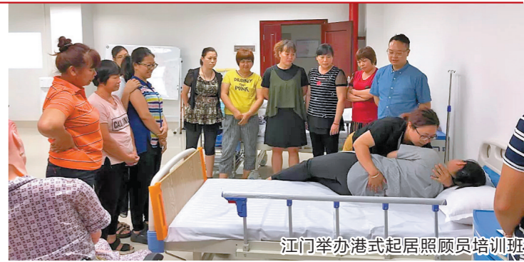
江门举办港式起居照顾员培训班

据了解,2016年,澳门单牌车入出横琴政策实施时,单牌车主和驾驶员80%以上的车驾管业务都需要到位于珠海市区的市交警支队车管所处理。从那时候开始,横琴公安发扬特区精神,让车驾管服务从一片空白发展到如今拥有全市唯一一个集科目一考试、满分学习、审验学习的服务点在内的健全服务体系,车驾管业务从零开始,实现了如今“90%以上车驾管业务可在横琴办理”的目标。