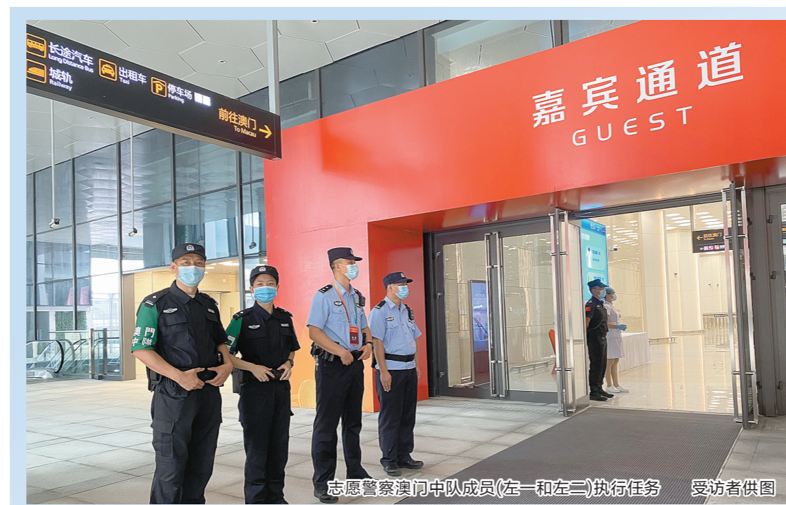
志愿警察澳门中队成员(左一和左二)执行任务

11月11日,案涉不动产整体交付给某置业公司。据悉,今年以来,面对常态化疫情防控和执行办案的双重压力,香洲法院提升司法服务保障能力和水平,强化善意执行、文明执行理念,找准各方利益平衡点,既维护申请执行人的胜诉权益,又最大限度减少对被执行人生产经营的影响。