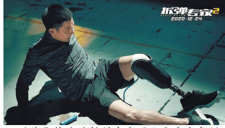
刘德华饰演的拆弹专家因公失去半条腿