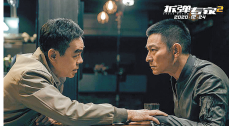
刘青云（左）与刘德华21年后再合作

以新一代的拆弹服为基础来设计。片中，一套拆弹服就重达40公斤，穿脱相当麻烦，刘德华和刘青云两位主演一穿就是一整天。电影拍摄时正值炎夏，两位主演在40℃的高温中穿着拆弹服，经常浑身湿透。此外，由于衣服厚重，两人走路时不免摇晃，幕后特辑也捕捉到他们在拍摄时差点摔倒的情形。