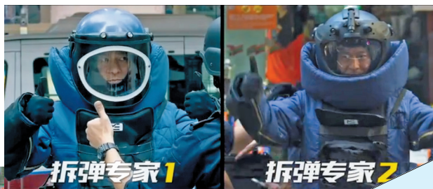
《拆弹专家2》（右）连拆弹服都改进了