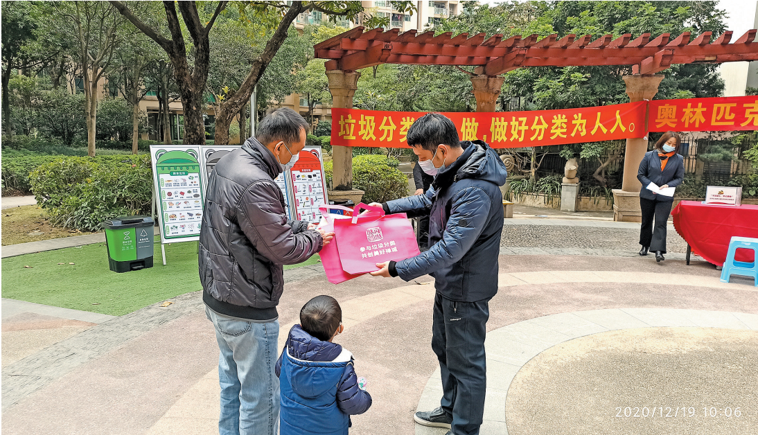
市民积极参与垃圾分类工作

宣传活动现场吸引了许多居民前来驻足观看，工作人员通过派发垃圾分类宣传单张、垃圾分类袋和使用分类展板等方式向居民详细讲解生活中常见的垃圾分类误区，普及垃圾分类知识，让居民对垃圾分类有进一步的了解。本次活动有近100个居民参加，