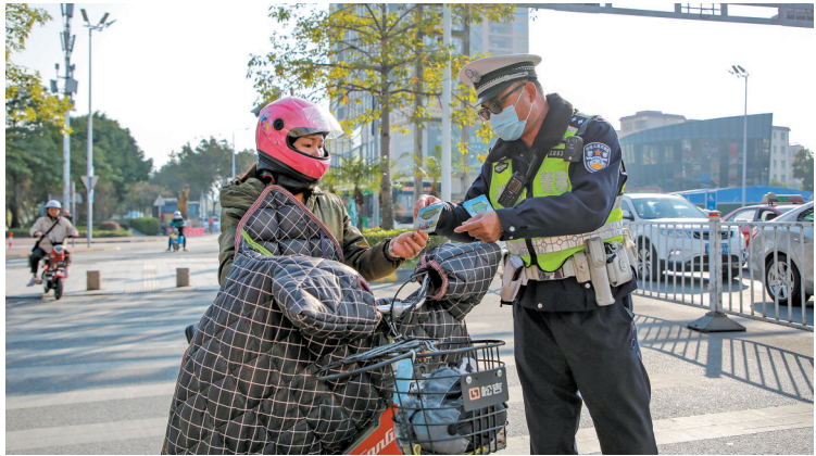
民警向市民讲解防寒设备隐患

羊城晚报讯 记者周哲、通讯员黄耀堃摄影报道：近日，广东逐渐降温，佛山街头部分骑电动自行车的市民开始佩戴防风车把手套、长围巾、挡风被等防寒保暖设备。这些“御寒神器”虽然抗寒效果明显，实则隐藏巨大的安全隐患。22日上午，佛山禅城交警出动警力在路面开展对市民冬日出行的安全教育行动。民警走上路面时使用防寒设备驾驶电动自行车的市民开展现场教育，讲解其使用维护，化解群众出行风险。