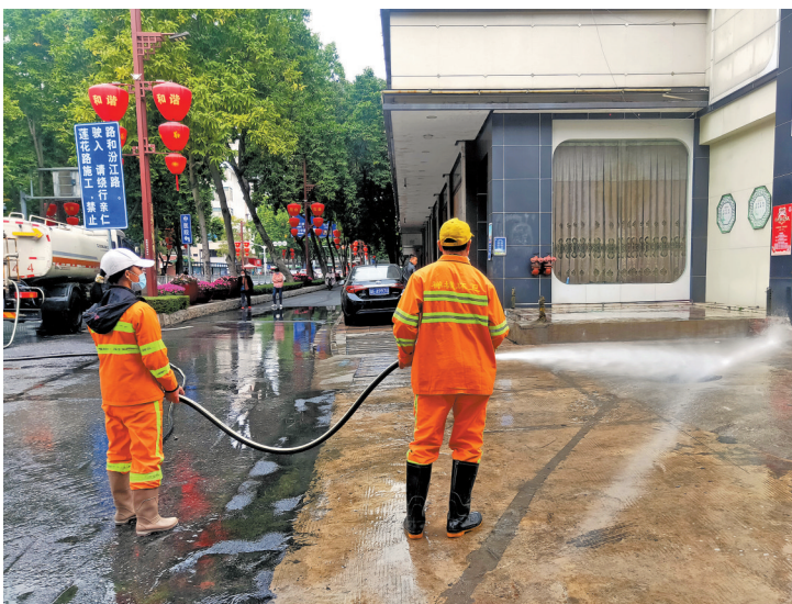
环卫工人正在开展清洁工作

在南庄片区，环卫工人对南庄大道、紫洞路、龙津东西路、陶兴路、紫洞路等9条主干道进行大规模的卫生死角清理。记者在南庄大道一侧看见，环卫工人们正拿着铲子和扫帚沿路清扫杂草碎石，他们利用手上的清洁工具把垃圾杂物铲松，随后铲车一把铲