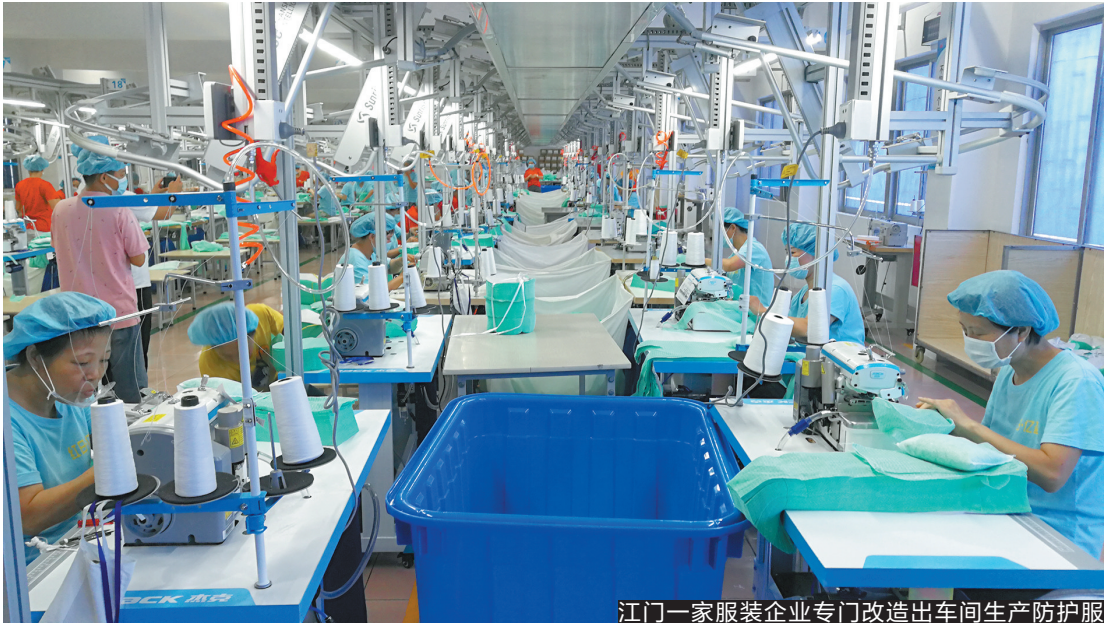
▲江门多家企业提供了大量防护服所需的胶条

有着深厚制造业基础的江门市,今年在新冠肺炎疫情防控应急物资供应方面作出重大贡献,而本土的医疗物资企业也顺势崛起。记者12月22日从江门市相关政府部门获悉,截至今年10月,江门已注册登记了逾7400家经营范围涵盖各类疫情防控应急物资的市场主体,并基本形成了一般公共卫生事件防控工作所需的三条应急医疗物资产业链。