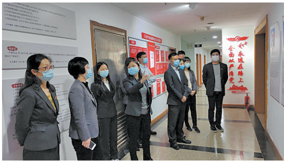
员工参观清廉文化空间