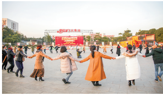
国内舞蹈“大咖”在戴爱莲广场上翩翩起舞

记者了解到,江门是唯一被中国舞蹈家协会授予“中国舞蹈之城”称号的城市,主城区蓬江区是“中国舞蹈之城”的实践核心区。“戴爱莲杯”人人跳全国群众舞蹈展演活动已在蓬江区举办了两届。在论坛上,中国艺术研究院舞蹈研究所副所长江东认为,江门可以更加全面践行戴爱莲先生“人人跳”理念,进一步丰富舞蹈展演的形式,朝着“高精尖”的方向,策划既有非遗性质,也有群众性质的舞蹈比赛。中央民族大学舞蹈学院院长马云霞则表示:“我认为江门舞蹈之城的品牌打造得特别好,与此同时,更要加强塑造品牌内涵。”