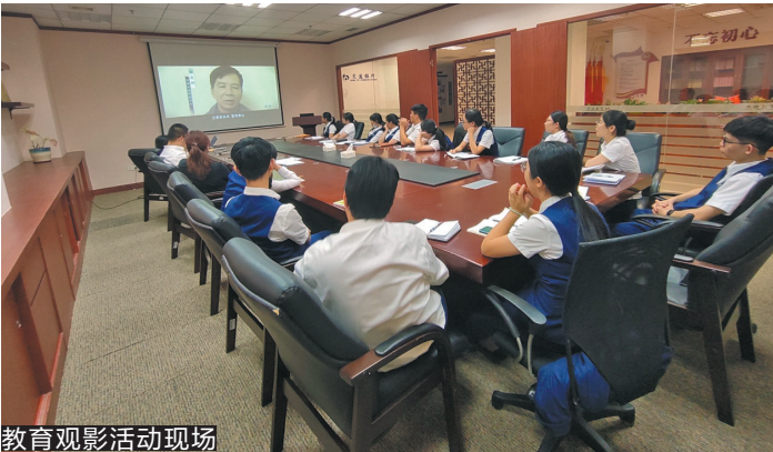
教育观影活动现场

为加强对干部职工警示教育,交通银行中山分行分场次有序开展反腐倡廉警示教育观影活动,组织基层支行员工观看由中共广东省纪律检查委员会、广东省监察委员会摄制的反腐倡廉教育片《侥幸之祸》《朽木浮沉》。