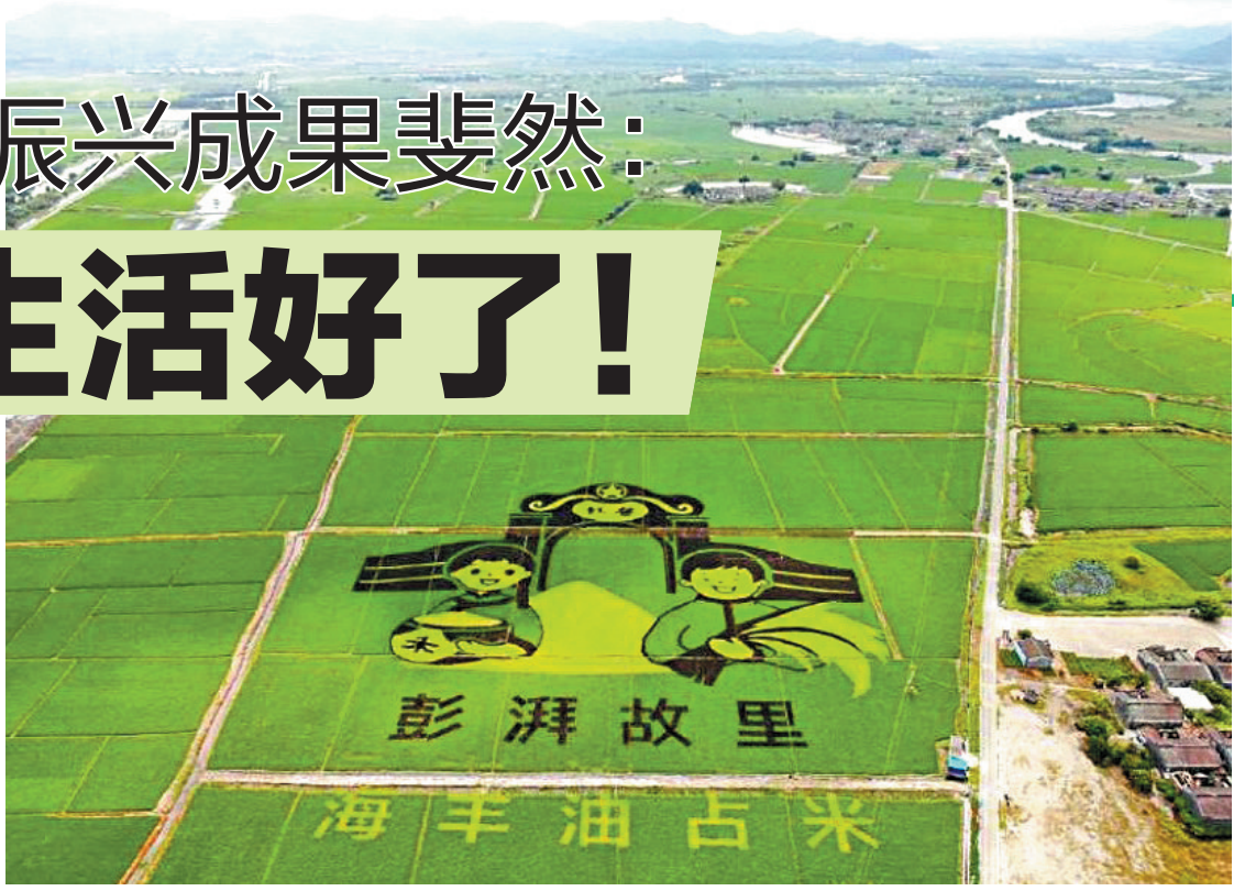
汕尾海丰县可塘镇万亩油占米生产基地

羊城晚报记者 赵映光 通讯员 善美宣 继2018、2019年取得全省实施乡村振兴战略实绩考核粤东片区第一名的不俗成绩后，汕尾在今年第二届广东十大美丽乡村系列评选活动中收获颇丰：陆河共光村荣获“广东十大美丽乡村”，陆丰下埔村荣获“广东文化旅游名村”，市城区晨洲村荣获“广东特色产业村”，海丰县湾区红色文化体验示范带荣获“广东美丽乡村精品线路”。 可以说，随着乡村振兴战略的实施，汕尾着力打造的一个个美丽乡村、一条条精品示范带、一片片诗意图园，正在释放出强大的发展动能。