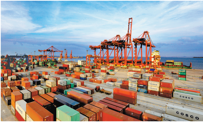
湛江综合保税区的设立将有利于树立湛江港在南中国港口的重要地位 资料图

心。《《国务院关于促进综合保税区高水平开放高质量发展的若干意见》》。区内实行“免税、保税、退税、选择性征税”为主的进出口税收政策，区内与境外之间进出的货物，除特殊规定外不实行进出口配额、许可证件管理，区内可以开展转口贸易、国际采购、分销和配送，国