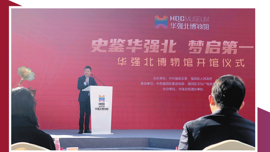
福田区区长黄伟推介博物馆