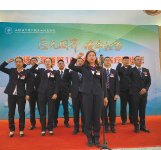
援加纳医疗队出征前宣誓

在欢送仪式结束后，汕大附一院援加纳医疗队11名队员便在亲属和同事们的告别声中，登上前往广州的大巴车，他们6日晚从广州乘坐飞机前往1.2万多公里外的加纳，正式开启援外的生活。