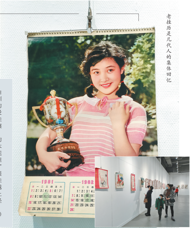
老挂历吸引了参观者驻足欣赏

据悉，本次展览的挂历均由博物馆所收藏，该馆是深圳市首家以民俗老物件为主题的非国有博物馆，特色鲜明，深受市民群众喜爱，本次展出的挂历，是管强多年来在全国各地辗转收藏而来。“以前我家每年都挂这样的挂历，那时我家还住砖瓦房、木板房，挂历直接钉在墙上。现在想想那些日子挺艰苦的，但是人们从未放弃对美的追求。”63岁的王先生看到这些挂历很动情，他说，看着几十年前的挂历神游，仿佛进行了一场穿越时空的对话，周末他还要喊上老伴一起来参观，追忆曾经的如歌青春。