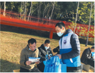
禁毒社工派发宣传资料

游戏互动中。同时，禁毒社工“猪肉藏毒”“威化饼加冰”及“AD钙奶存麻古”等贩卖毒品的真实生动事例告诫过往游客春节假期将至，在帮助陌生人携带物品时或接受他人赠品时需保持防毒警惕性，同时要加强对禁毒知识的学习，从思想上牢固树立“远离毒品，珍爱生命”的意识。