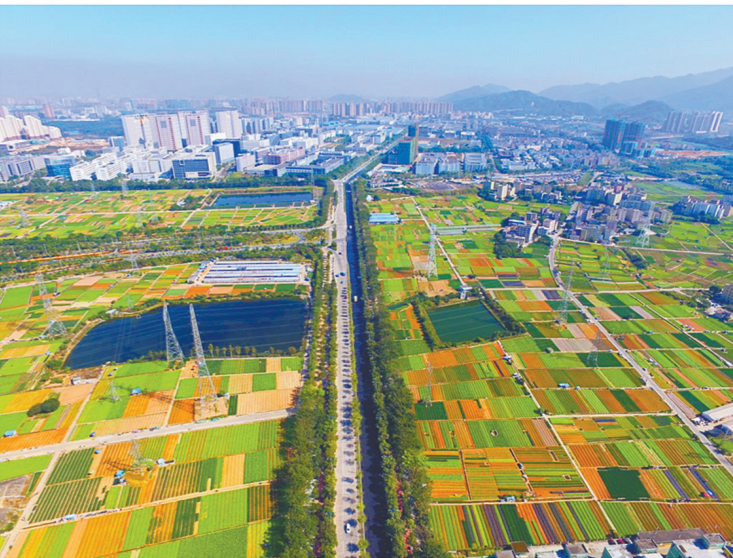
龙田街道打造休闲农业旅游基地