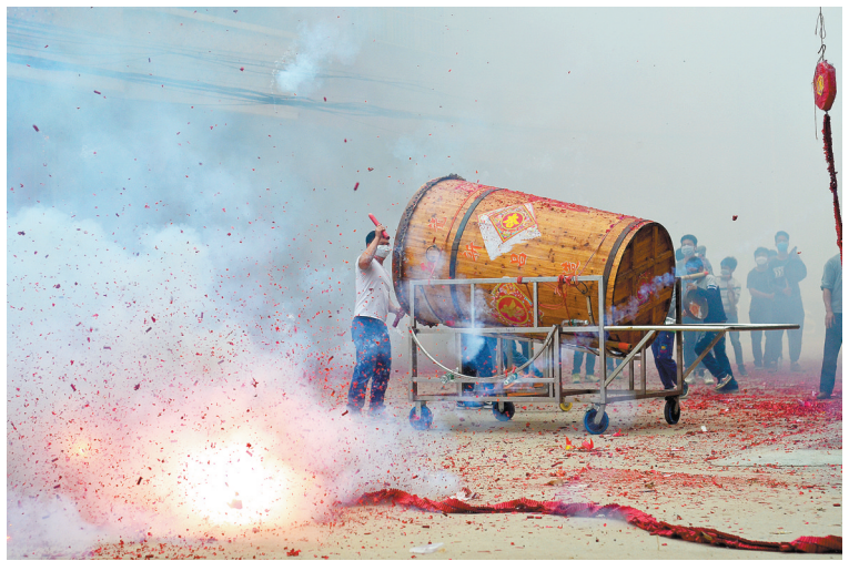
正月初六博罗湖镇陈村陈氏族人卖力敲湖镇大鼓