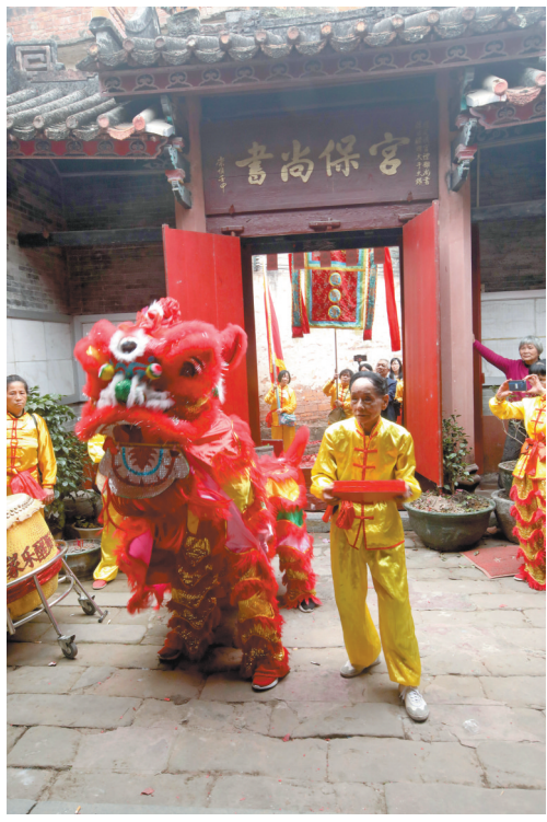
博罗韩氏大宗祠舞狮活动