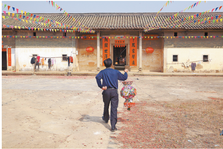
横沥镇陈氏族人为新丁举行“上灯”仪式