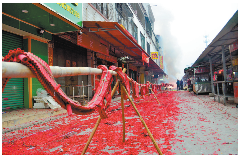
博罗湖镇陈村陈氏买“灯”，爆竹声声响连天