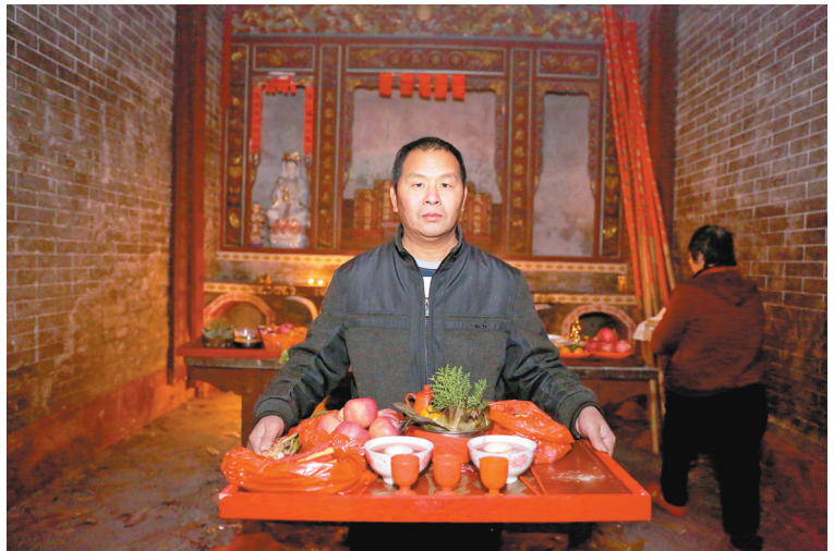
鹤溪村“灯叔公”在“关氏家庙”祭祖