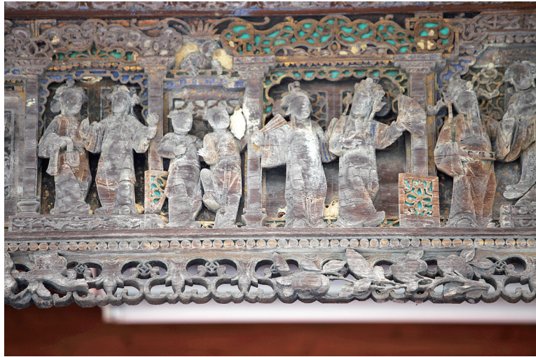
博罗旭日村聘君陈公祠木雕