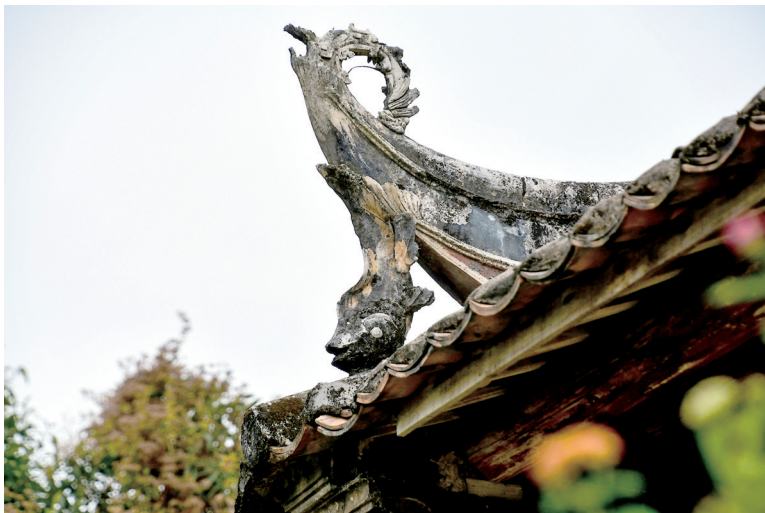
博罗公庄吉水围村朱氏公祠堂精美雕刻