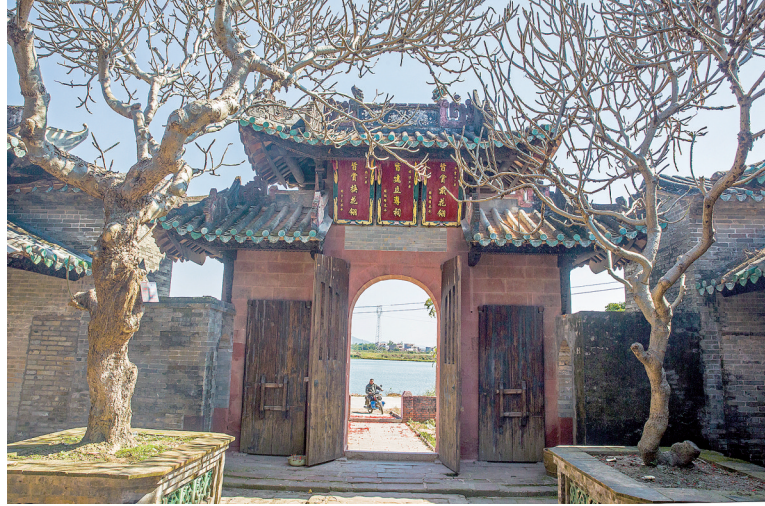
鹤溪村愈南公家庙正门后墙有御封匾匾