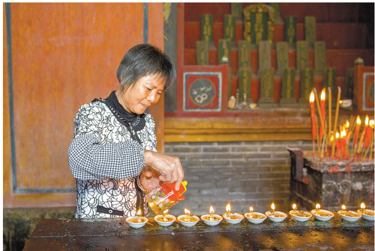
博罗湖镇胡氏祠堂“灯祖婆”为象征新生命的“油灯”加油续航