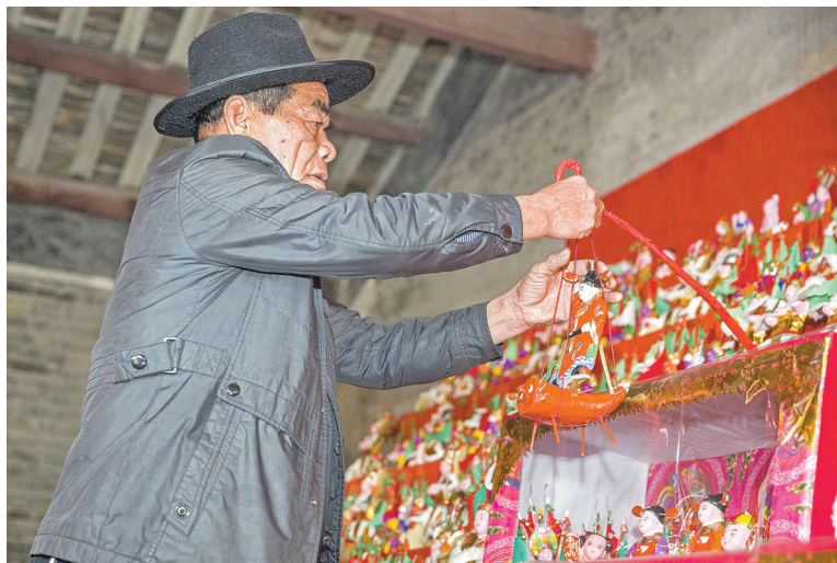
挂起“状元郎”泥偶，期盼“新丁”长大学业有成