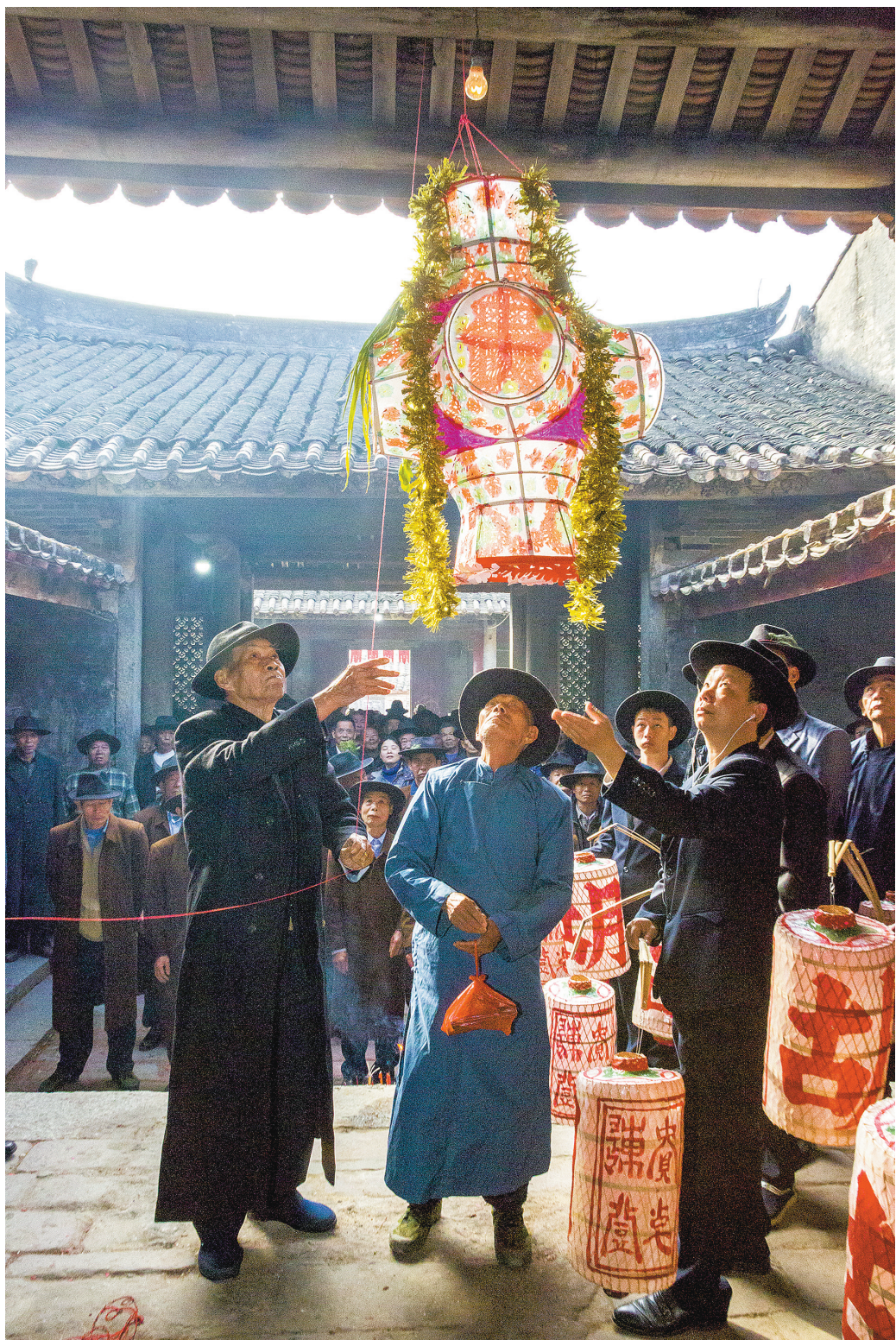
胡氏祠堂族长亲手将“公灯”升挂于“子孙楼”