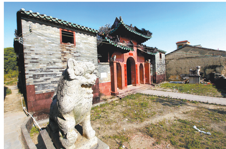
鹤溪村愈南公家庙前石像