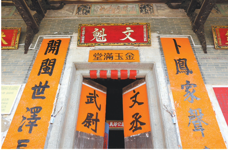
横沥镇陈氏大夫第祠堂正门中间高悬“文魁”匾额

宋代诗人王安石曾为春节写下这样一句诗：“爆竹声中一岁除，春风送暖入屠苏。”提起爆竹，不少人脑海浮现出孩童在村宗祠前放爆竹、贴对联的画面。 元旦过后，春节将至，各地宗祠也迎来一年中最具生机与活力的一刻。宗祠是一种传统文化建筑，它承载着中华民族五千年历史文化发展的印记，是沟通未来城乡发展的重要媒介，也是一种信仰。 在岭南，散布在各城市、乡镇、村落间的宗祠数不胜数，并且这些宗祠经过千百年代代传承，记录着家族的辉煌与传统，激励着人们弘扬良好家风，潜移默化中影响着岭南人的精神世界。 众所周知，惠州文化是岭南文化的重要组成部分。走访惠州古村落，就会发现一个特点，即“村村皆有宗祠”。本版影像在色彩、艺术视角等方面呈现出一次视觉盛宴，唤起大家对宗祠的记忆。 从摄影作品中宗祠建筑、祠堂内装饰与丰富多彩的宗祠活动可看出，惠州宗祠多元传统文化并存与交融。惠城、惠东、龙门、博罗等处的宗祠各具特色，其中最早的宗祠自宋代起流传至今，有着悠久的历史。历经岁月侵蚀，部分祠堂亟需加固或修缮。 惠州宗祠建筑也别有融合风味，本土文化、广府文化、客家文化等相互交融，显示出惠州多元文化结合的特色。从细节处可以窥见，惠州人富有强烈的传承意识，共同维护着一个代代相传的宗祠。 在2020年新冠肺炎疫情的影响下，惠州百姓深刻体会到生命诚可贵及与亲人团聚的重要性，更为尊重和重视家族历史文化，努力将宗祠文化继续传承与发展下去，这不是一种刻板思想，而是对前人的尊敬与对美好未来的憧憬与向往。 宗祠给了家族凝聚力，唤起族人共同的文化记忆，每个人都应该参与、出力，保护宗祠建筑，敬重传统习俗，将宗祠文化更好地传承下去。