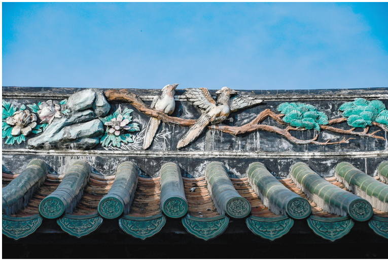
沥林罗村谢氏宗祠精美木雕，重现当年繁华