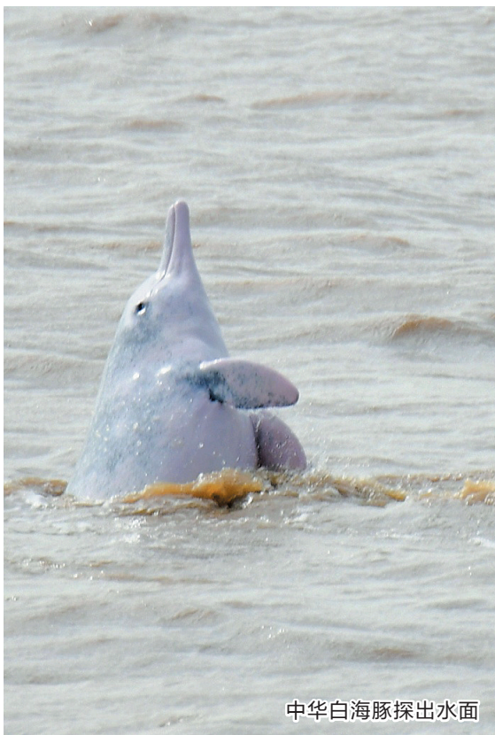
中华白海豚探出水面

提起白海豚可谓是无人不爱,它被称为水上“大熊猫”,一向是以珍稀海洋生物的代表出现在我们的视野。近日,摄影爱好者苏锦灵就十分幸运地在珠海机场附近海域,拍到了它们的身影,只见一群白海豚,或跃出水面,或追逐嬉戏,玩闹了一个多小时才消失在视野中。