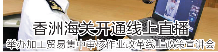
香洲海关开通线上直播 举办加工贸易集中审核作业改革线上政策宣讲会

日前,拱北海关所属香洲海关以线上直播的方式,举办加工贸易集中审核作业线上政策宣讲会,为关区150余家进出口企业及报关企业代表介绍了加工贸易集中审核作业改革运行情况及相关作业流程,并就业务办理流程等问题进行了耐心细致解答(见图)。