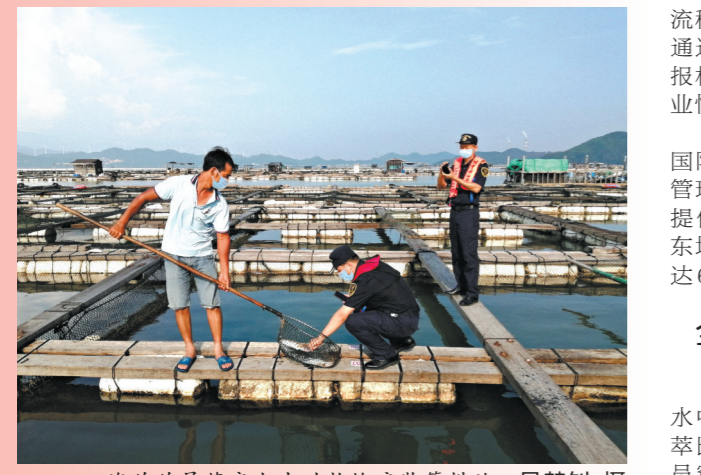
海关关员落实水生动物检疫监管措施

清晨，揭阳市揭西县坪上镇鸿锦蔬菜种植基地，在海关关员监管下，菜农将田间刚采摘的新鲜小白菜过秤、装箱，准备运往港澳市场；晌午，在梅州市梅县区阿海水果专业合作社出口柚园，海关关员忙着查看柚果生长情况，组织实施检验检疫实蝇监测；傍晚，经海关检验检疫合格，满载鲈鱼、红色海水箱养殖活鱼的渔船，从潮州市饶平县养殖场启运海外……日暮晨昏，寒暑荣枯，汕头海关关员始终身在一线，为粤东地区（包括汕头、潮州、揭阳、汕尾、梅州五市，下同）出口食品农产品安全保驾护航。