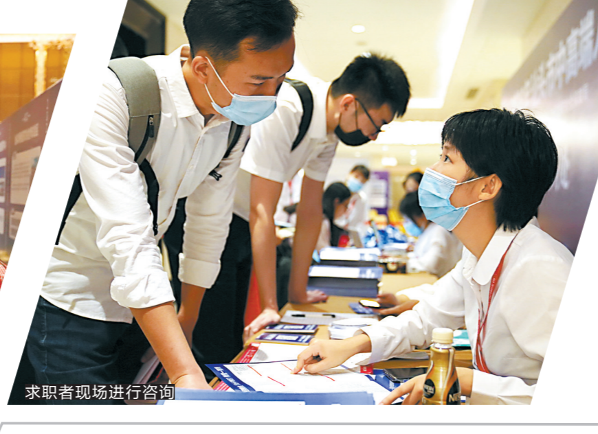
求职者现场进行咨询