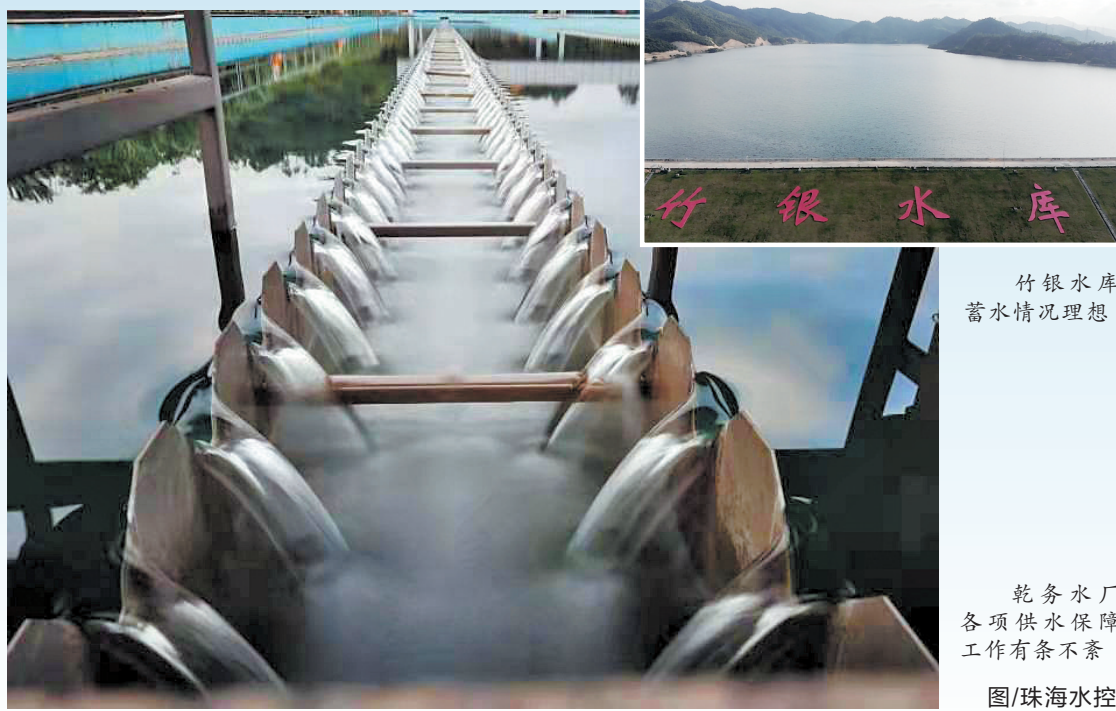
竹银水库蓄水情况理想