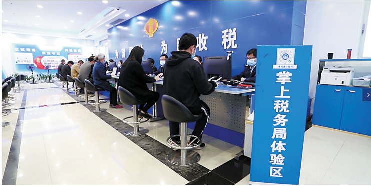
税务部门通过网上办税等措施增加办税便利度

3日，江门市税务系统召开全市税务工作会议，记者从会上获悉，去年，江门税务系统全面落实7批28项税费优惠政策，1至11月新增减税降费近70亿元，其中，2020年出台的支持疫情防控和经济社会发展“双统筹”税费优惠政策新增减税降费49.76亿元。目前，广东省税务局通报了全省（不含深圳）纳税人满意度调查结果，江门市位列第一。