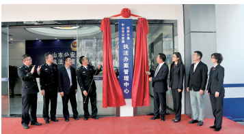
坦洲公安分局执法办案管理中心揭牌

该中心将按照“一站式办案、智能化管理、全流程监督”的要求，推进执法监督管理机制改革。首先，将实现专业化管理，集中提供入区登记、安全检查、信息