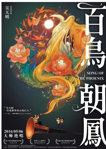
《百鸟朝凤》制片人下跪求排片曾掀起热议