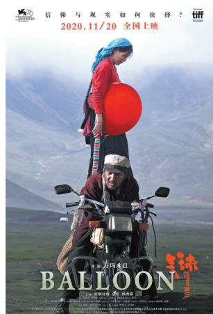
万玛才旦作品《气球》票房与口碑不对等