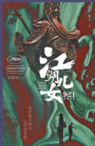
贾樟柯作品《江湖儿女》票房近7000万元