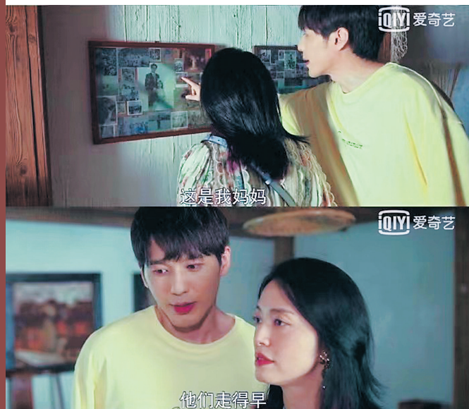
《假日暖洋洋》擅自使用网友父母结婚照

最近,有网友大吐苦水,称其父母的结婚照在不知情的情况下无缘无故出现在剧集《假日暖洋洋》中,而且照片被用作剧中遗照。近年来,影视作品盗用或误用普通公民个人信息的事件频发,其中不乏热播剧。个人信息的泄露对当事人的生活造成极大影响。曾有受害者将侵权剧组告上法庭,并最终获得胜诉。