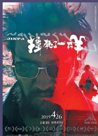
万玛才旦作品《撞死了一只羊》票房约1038万元