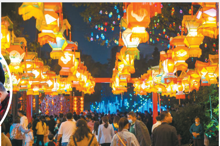
锦绣中华花灯璀璨