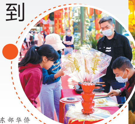
东部华侨城非遗展示