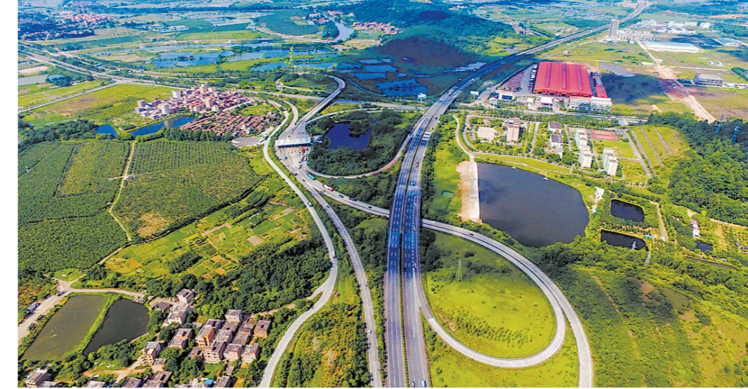
今年高明将大力推进交通大会战

建成国家知识产权强县工程示范区，万人发明专利拥有量增至37.97件。存量高新技术企业217家，较“十二五”期末增长5.86倍。 乡村振兴打开新局面。高质量完成革命老区特别帮扶三年行动计划，建成示范村4个、重点村11个，新增省卫生村271个，全部村居基本达到干净整洁村标准，在2019年度全省推进乡村振兴战略实绩考核中获评优秀等次。 报告提到，高明改革开放取得新成效，完成一级办学、一级办医管理体制改革，智慧市场监管体系建设列入省改革推广试点，构建制造业高质量发展综合评价体系获省经信厅支持打造全省改革试点；民生福祉达到新水平。财政民生支出累计171亿元，占一般公共预算支出