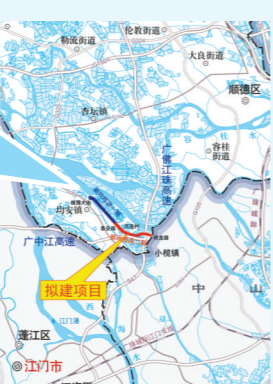
▶项目总体线路示意图

羊城晚报讯 记者欧阳志强、通讯员邹佩涛摄影报道：2月24日，佛山市新均榄路建设再传喜讯，自新均榄路一期工程在2020年建成后，二期工程正式动工。据透露，二期工程2023年建成通车后，将进一步连接佛山市顺德区均安镇与中山市小榄镇的跨市新通道，进一步加强佛山市和中山市的交通联系。 据悉，该二期工程为广东省重点建设项目，其线路起于顺德