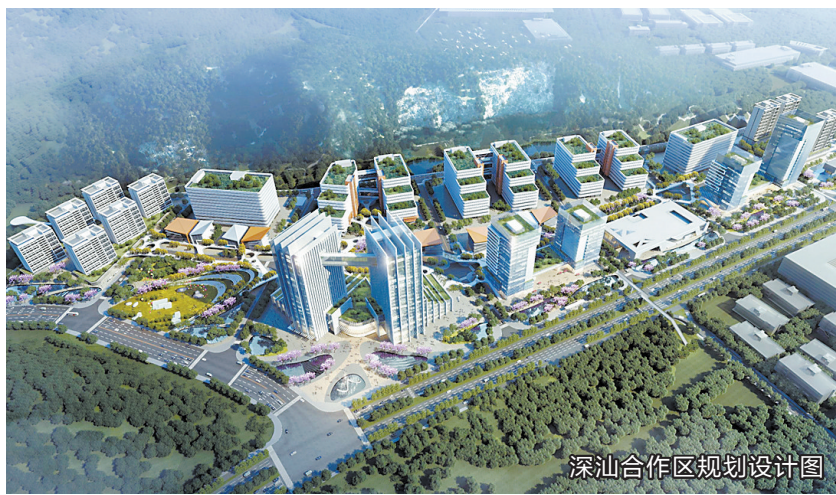
深汕合作区规划设计图