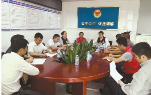
南湾街道矛盾纠纷联调联处中心,走出基层治理新路径