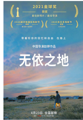
《无依之地》内地海报