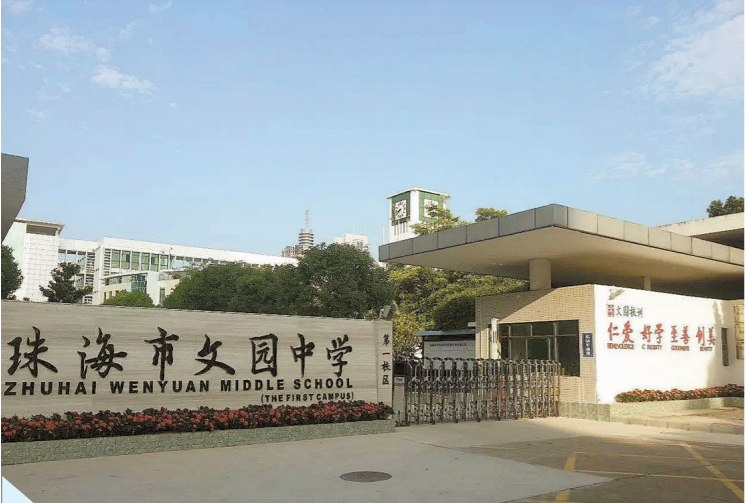
珠海市文园中学附近的学区房被热捧

“这些客人们都在等业主……”“看谁能抢到……”日前,珠海出现数十家买家同看一小户型学区房的场景,中介拍摄的视频也在朋友圈被很多人转发。根据视频内容,目测至少有十多个买主在现场等业主回来看房,结果也是没有悬念,房子当场就成交了。据悉,近期珠海学区房成交量明显上升。