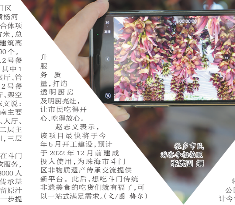
很多市民纷纷争相拍照

在珠海斗门,那一块块肥而不腻、香气扑鼻的大赤坎明火叉烧烧排骨,总吸引着大批珠海吃货游客。但由于场地限制,几乎每个周末及节假日都会满座,不少人需要排队。不过笔者最近获悉了一个新消息,在大赤坎村将会新建一座非遗传承基地综合体,将可同时接待3000人。大赤坎明火叉烧烧排骨是斗门当地民间一种传统美食,它既传承了广东叉烧的风味,又独创了自身的酱料配方和加工工艺,被列为市级非遗名录。据珠海斗门区肥仔乡村旅游发展有限公司负责人赵志文介绍,这座即将新建的非遗传承基地综合体,主要功能为促进斗门及周边地区非物质文化遗产传承与交流,将融合非遗文化、非遗美食、非遗农产品等元素,打造特色非遗旅游体验,建设非遗特色综合体。根据《建设工程规划许可项目批前公示(斗门非遗传承基地综合体项目)》显示,珠海市斗门区肥仔乡村旅游发展有限公司计划于斗门区斗门镇大赤坎省道272北侧、黄杨河南侧建设斗门非遗传承基地综合体项目,总用地面积为6514.96平方米,总建筑面积为10297.14平方米,建筑高度为24米,提供机动车停车位90个。建设工程包括1号餐饮楼、2号餐饮楼、风雨连廊及水榭4部分,其中1号餐饮楼内设餐厅、非遗文化展厅、管理用房及架空空间等功能,而2号餐饮楼内则有餐厅、非遗文化展厅、架空停车位及其他功能用房。赵志文说:“项目拟建设3层,首层由北向南主要分为非遗制作工艺及其展示区、大厅、农产品销售区及非遗展示区,二层主要为旅游用餐及休闲体验空间,三层则为文化展示和交流综合厅。”“项目投入使用后,我们将在斗门非遗传承基地综合体提供餐饮服务,预计可以同时接待2500人至3000人就餐。”赵志文表示,斗门非遗传承基地综合体内的餐饮服务将在保留原汁原味“大赤坎风味”的基础上进一步提升服务质量,打造透明厨房及明厨亮灶,让市民吃得开心、吃得放心。赵志文表示,该项目最快将于今年5月开工建设,预计于2022年12月前建成投入使用,为珠海斗门区非物质文化遗产传承交流提供新平台。此后,想吃斗门传统非遗美食的吃货们就有福了,可以一站式满足需求。