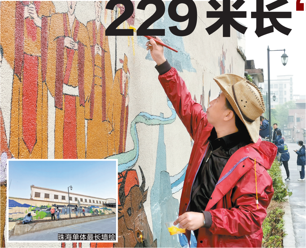
40位专业艺术教师和学生共同绘制斗门版“清明上河图”

北宋画家张择端仅见的存世精品——清明上河图是中国十大传世名画之一，它以宽24.8厘米、长528.7厘米的长卷画详细地描绘了北宋的风俗人情而闻名。在珠海斗门南门村，一幅229米的珠海单体最长的历史墙绘目前正处于完工尾声，被当地人称其为珠海版的“清明上河图”。