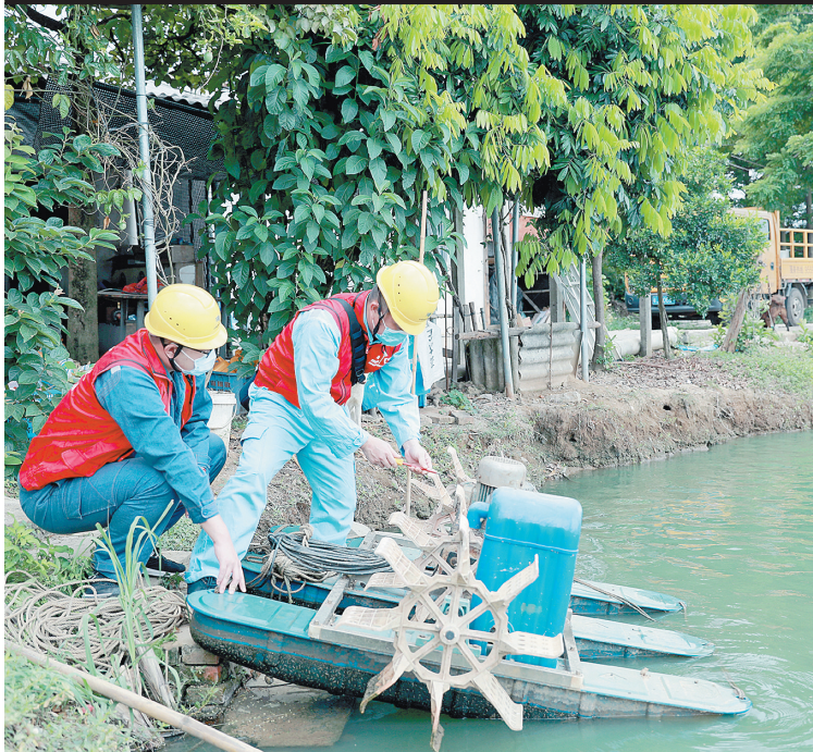
江门蓬江供电局“上门”为渔民做好供电服务