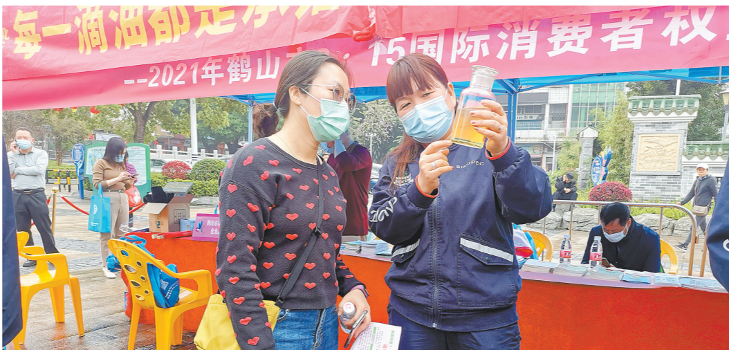
工作人员向市民讲解油品知识

在“3·15”保护消费者权益日来临之际,为了让消费者近距离了解加油站知识,3月6日,江门中石化联合鹤山市政府相关部门在北湖公园开展以“质优量足、客户满意”“每一滴油都是承诺”主题宣传活动。主办方通过发放宣传资料,展示优秀油品、计量器具等形式向广大市民宣传中国石化油品知识。