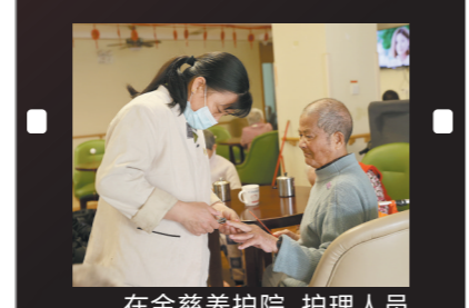
在金慈养护院，护理人员帮老人剪指甲

提升服务，满足老年人生活照料、医疗护理、文化娱乐、心理慰藉等多样化的健康养老需求。 通过坚持“用心关怀、用爱护理”的服务理念，东坑医院护理院不仅托起了老人们幸福的“夕阳红”，也收获了诸多荣誉——全国“敬老文明号”、全国医养结合典型经验单位、广东省五星级养老机构等。 在东莞，类似东坑医院护理院这样的医养结合机构共有8家，都开展了医疗康复、健康养老、功能康复训练、长期照护、临终关怀等服务。而作为国家级医养结合试点城市，东莞正在积极探索多元化的医养结合方式，初步建立了医养结合服务网络，改革成效明显。 据市卫生健康局介绍，除了医养结合机构外，东莞的养老服务逐渐向居家社区延伸，以家庭医生签约为抓手，结合基本公共卫生服务项目为居家老年人提供医疗护理服务。鼓励医疗机构与养老机构开展多种形式的合作，加大综合医院老年病专科建设等。