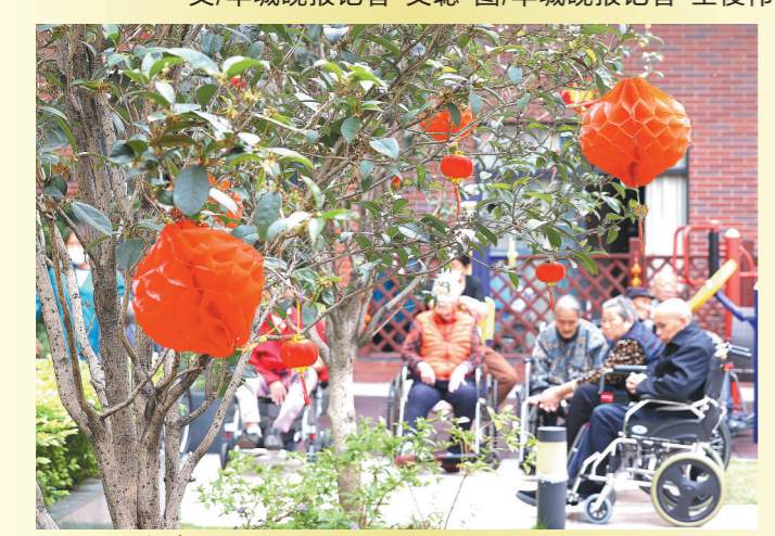
护理院托起幸福“夕阳红”