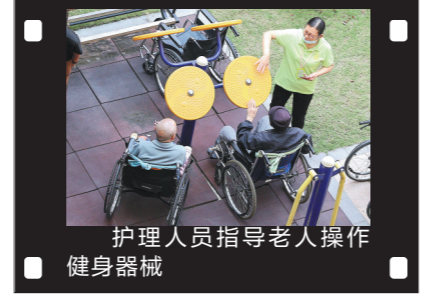
护理人员指导老人操作健身器械