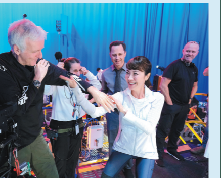
卡梅隆与杨紫琼在《阿凡达2》片场

CG技术、动作捕捉技术等这些今天的观众已经司空见惯的电影专用语,对于11年前的观众来说仍是新鲜名词。毫无疑问,在多项电影技术的开发运用上,詹姆斯·卡梅隆都堪称“鼻祖”。2009年,卡梅隆曾接受过羊城晚报记者的专访,当时他便透露,自己其实早在1995年便有了《阿凡达》的剧本构想,但“必须等待,等待电影技术发展能实现我的梦想”。而这一等,就等