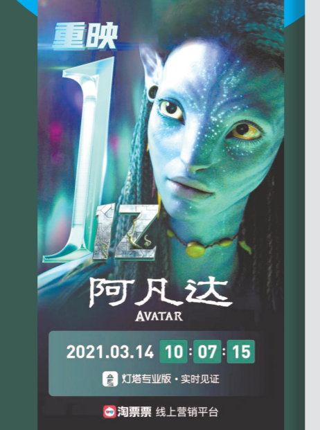
重映 阿凡达 AVATAR