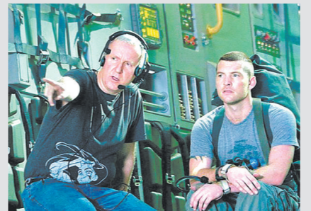
卡神(左)给演员说戏

国已有716家。总体来看,2010年国内全年新增影院313家,新增银幕数1533块,平均每天新增4.2块。在软硬件同时发力的情况下,中国电影的市场规模有了突破性的增长。2010年初,业界专家曾根据当时中国电影总票房每年约30%的增幅,预测当年总票房将突破80亿元,次年则突破100亿元,但因《阿凡达》的强势推动等原因,2010年总票房达到101.72亿元,“百亿大计”提前完成。如今,中国电影市场已成为全球翘楚:2019年,中国电影总票房达到642.66亿元;2020年在疫情影响下虽有半年“影院空窗期”,但仍以204.17亿元的总票房位列全球第一;2021年春节档,更创下超78亿元的惊人票房纪录。