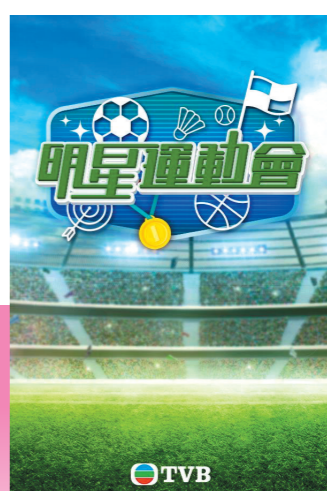
TVB将推出多档新综艺

影视展还公布了另外两个重点综艺节目。《周日大综艺》是一档“专为观众打造的周日开心节目,全港歌手一展歌艺的表演平台,更新热门时事、城市热话,以嬉笑怒骂的方式呈现”。《明星运动会》则将召集艺人、歌手、名人等参加,一方面发掘演艺圈中的运动达人,进行紧张刺激的专业比赛;另一方面找一批体育细胞欠奉的艺人,进行另类运动比拼,大放笑弹。