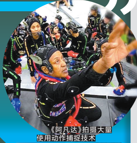
《阿凡达》拍摄大量使用动作捕捉技术

有评论认为,《阿凡达》重映热度不高很正常——毕竟是一部11年前的老片了,当年让观众惊为天人的3D技术如今早已不是不少国内外大片的“标配”。但《阿凡达》归来只是为了积攒一点票房,重夺全球票房冠军宝座吗?这么想,却也未免太低估了它。事实上,不少首次观看《阿凡达》的年轻观众以及在11年后走进影院“二刷”的观众,都表达了该片在今天带给他们的震撼。通过重温《阿凡达》,我们也得到一次回首这11年来中国电影市场和工业化进程飞速发展的机会。