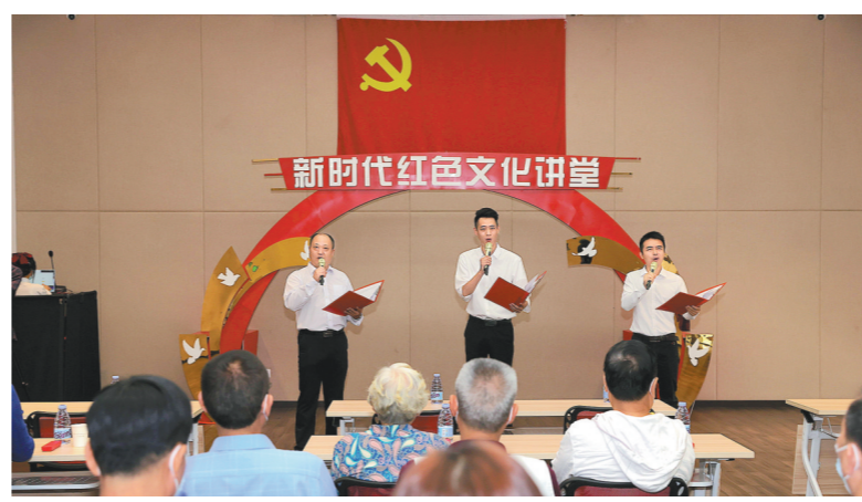
陈列馆经常举办新时代红色文化讲座

1927年9月1日，林伟民因病医治无效与世长辞，年仅40岁。从一名海员工人到崇高的革命者，林伟民为工人运动作出了巨大贡献。