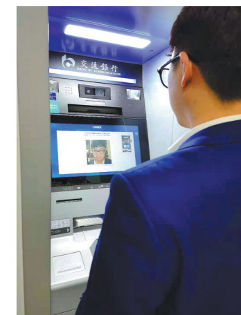
自助设备取款人脸识别功能上线运行

市的其他区域自助点拓展，进一步提升自助设备的服务效率和风险控制水平，履行金融机构的社会责任。