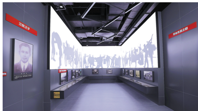
升级改造后的陈列馆新增了多媒体表现形式