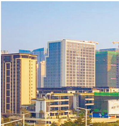
文/图 羊城晚报记者 欧阳志强

3月23日,“才聚顺德 智汇小镇”高层次人才平台建设暨高科技产业成果研讨交流会在南方智谷顺德新能源汽车小镇举办,亿固新材料研究院、固态电池与集成电路研究院正式签约落地,未来研究院将立足顺德,加快推进新能源产品技术研发,实现科技成果转化,提升顺德智能制造水平,辐射佛山及整个湾区市场应用。