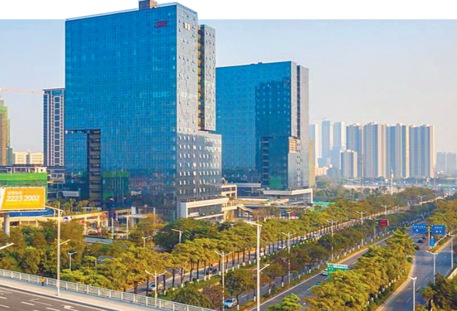
顺德新能源汽车小镇实景图

来自中科院广州能源所教授朱冬生提出,空气品质、含氧量已逐步影响现代人的生活品质,其团队致力研发的换热器已取得一定成果,希望未来能走进顺德,与新能源产业、家居家具产业