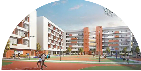
▲李兆基中学扩建工程效果图

伦教翁祐中学扩建工程，预算1亿元人民币，包括学生宿舍楼3栋，各7层，楼高约24米，新增2520个宿位；综合楼1栋，楼高约24米，楼面6层，基底面积约1409平方米，总建筑面积约8456平方米，首层架空，二至六层为教室，新增学位800个。