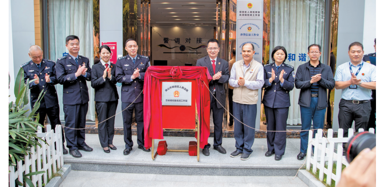
该工作站将定期或不定期开展法律咨询等工作 成立仪式现场

据悉，此次挂牌成立警诉调对接北滘工作站也是政法队伍教育整顿活动开展中为群众办实事的一项创新工作。