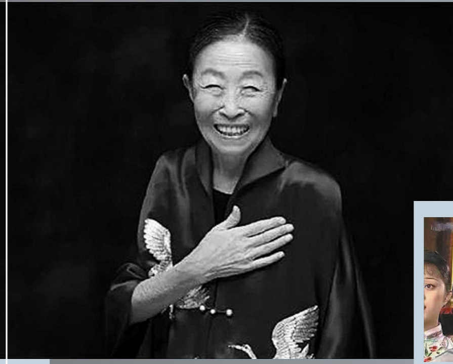
张少华凭《秘密》获白玉兰奖最佳女主角

张少华从艺近六十年,拍摄了《大宅门》《五月槐花香》《常回家看看》《我的丑娘》《铁梨花》《勇敢的心》等影视作品,塑造了众多观众喜爱的母亲形象,获得第11届上海电视节“白玉兰”奖、摩纳哥国际电影节最佳女配角奖和国剧盛典终身成就奖。消息称,自2010年9月起,张少华深受慢性阻塞性肺疾病困扰,多次住院治疗。在她患病期间,依然拍摄了许多作品,如《背着奶奶进城》《我们纯真的年代》《娘道》等。