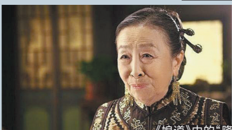
《娘道》中的“隆老太太”