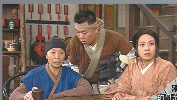
《武林外传》中饰演“李大嘴”的母亲“断指轩辕”