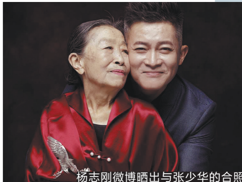
杨志刚微博晒出与张少华的合照

轩辕”。不少网友听闻张少华逝世的消息后在微博留言:“李大嘴,以后你没有娘了!”李大嘴的扮演者姜超也发微博悼念:“惊闻少华老师仙逝,悲痛万分!想起和老娘在一起拍戏的点点滴滴不禁泪流满面,从此《武林外传》的李大嘴就永远没有了他的轩辕娘了!老娘,一路走好!”