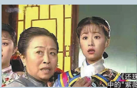
《还珠格格2》中的“紫薇舅婆”