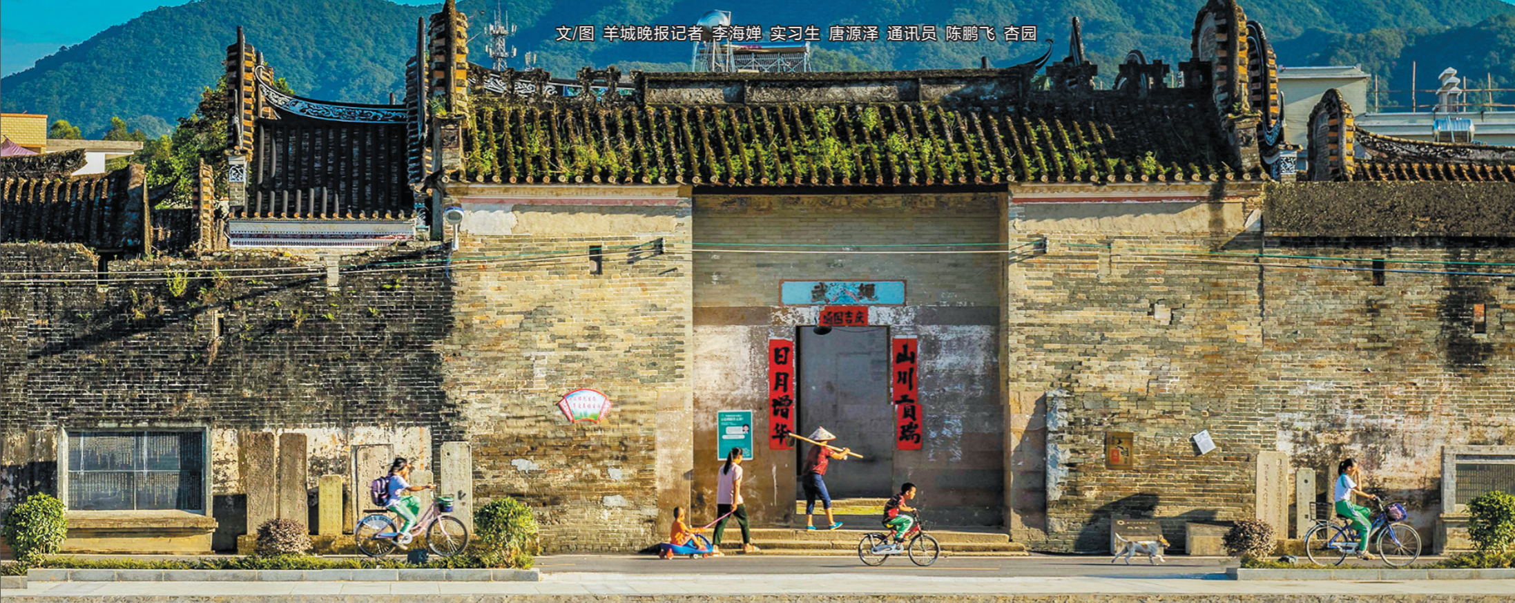
数百年未，绳武围巍然屹立，守护村民