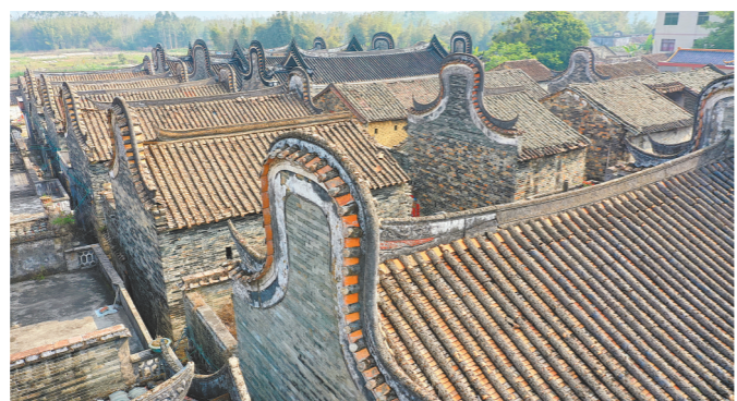
绳武围基本保持完好，精美漂亮

高大的围墙、雄伟的阁楼、古朴的民居……绳武围位于龙华镇龙华村委会新楼下村小组，拥有400多年历史，占地面积约为1.5万平方米。一道厚重的古城墙将传统的绳武围和热闹的龙华圩镇隔开，墙内墙外宛如两个世界。 远远望去，绳武围俨然一座坚固的城堡，气魄不凡。门楼前，是一个半月形的池塘，门楼两侧，立着多块清代的功名夹，依次刻着绳武围李氏读书人在清朝乾隆、咸丰等不同年代考取功名者的名字，其中还有在京城履职