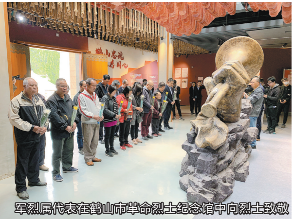
军烈属代表在鹤山市革命烈士纪念馆中向烈士致敬