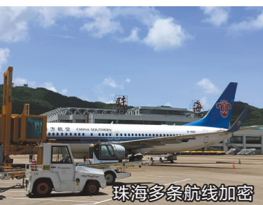
珠海多条航线加密

羊城晚报讯 记者钱瑜、通讯员韦壹夫摄影报道:2021年民航夏秋航季自3月28日开始,到10月30日结束。25日,羊城晚报记者从南航珠海公司了解到,本次换季,南航