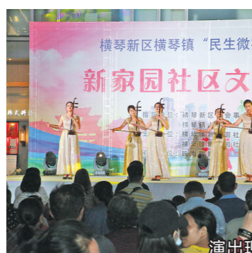
演出现场

记者了解到,在国家东西部扶贫协作和对口支援政策的指引下,2014年起,广东省对口支援甘孜州,其中江门对口支援甘孜州康定市和泸定县。截至目前,江门市累计对口支援当地共40项民生保障项目,支投资金4.15亿元,并根据当地实际需求增加援建资金1060