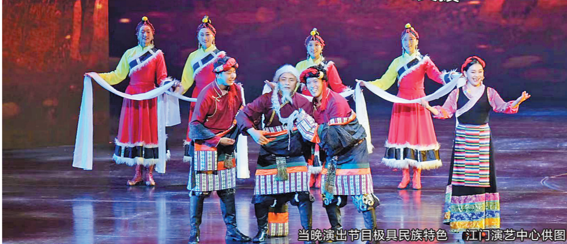
当晚演出节目极具民族特色

万元,增加援建项目9个;同时江门市积极助力当地农特产品“出山”,销往更广阔的市场,消费扶贫资金达3.9亿元,带动甘孜州5000多名群众增收。