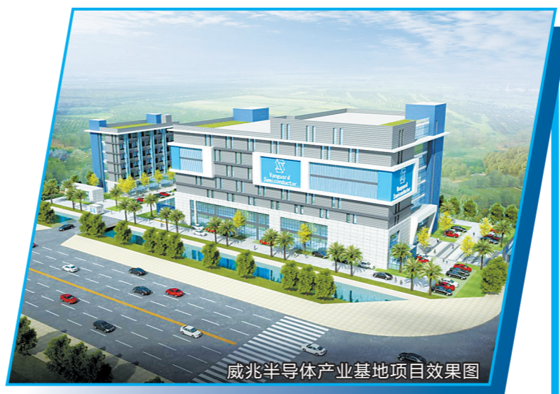
威兆半导体产业基地项目效果图

“资源互补+合作共赢”“深圳总部(窗口)+深珠合作研发、生产”的发展模式,积极做好和深圳产业对接、支持科技成果到珠海转移转化工作。