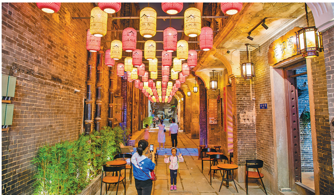
江门有不少具有浓厚华侨文化底蕴的景点