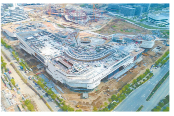
金湾华发商都正在加快建设

相关负责人介绍，金湾华发商都以“街区商业+集中式商业”的形式出现在消费者面前。其中，集中式商业业态主要是零售、餐饮、超市、影院、娱乐和儿童主题区；街区商业将为零售、餐饮、娱乐配套组团。基于25—45岁城市中产的目标人群市场需求，项目规划了科技互动体验、亲子成长互动、品质生活采