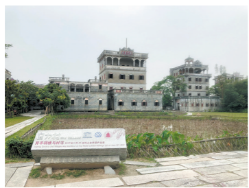
开平碉楼文化旅游区以文化“赋能”打造沉浸式旅游

华侨是五邑的底色，文化是江门的“招牌”。在日前举行的江门市2021年全域旅游工作现场会上，“华侨”“文化”成了热议的关键词。记者了解到，在今年的全域旅游工作中，江门将以文铸魂，以侨为桥，坚持以文塑旅、以旅彰文，构建“文化+旅游”全产业链深度融合。