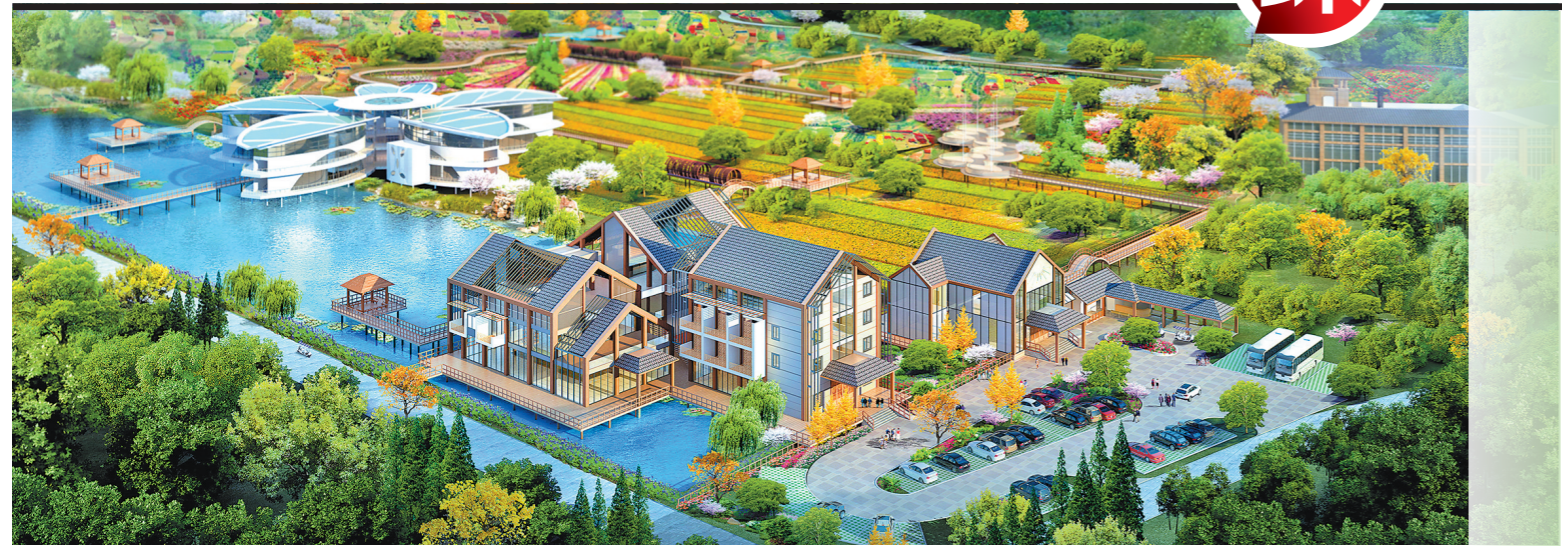
岭南大地百草园项目效果图