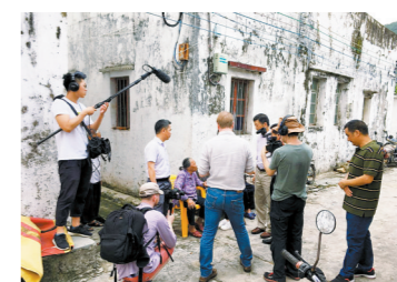
《六人》摄制团队2018年前来台山拍摄

羊城晚报讯 记者陈卓栋、通讯员谭耀广报道：记者30日从《六人：泰坦尼克上的中国幸存者》官方微博上获悉，该纪录片将于4月16日上映。据悉，该片记录了泰坦尼克号6名中国幸存者的故事，根据制作团队的采访确认，这6名中国幸存者很有可能均来自江门台山市。