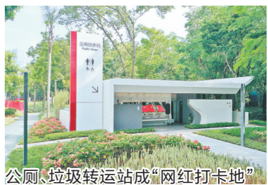
公厕、垃圾转运站成“网红打卡地”

全方位赋能,变“粗管”为“精治”。打造全市首个区级“环境精细化管理系统”,建立“线上监督+线下核查”机制,构建“区局监管+街道主管+企业执行”协调推进机制,有效将管理末梢延伸到一线,通过清单式、动态化、全时段监管实现环卫企业由“不见人、不见车”到人员、车辆、心思三到位的转变,“环卫工人出勤合格率”和“机械化作业完成率”由原来的63.75%、52.38%提升