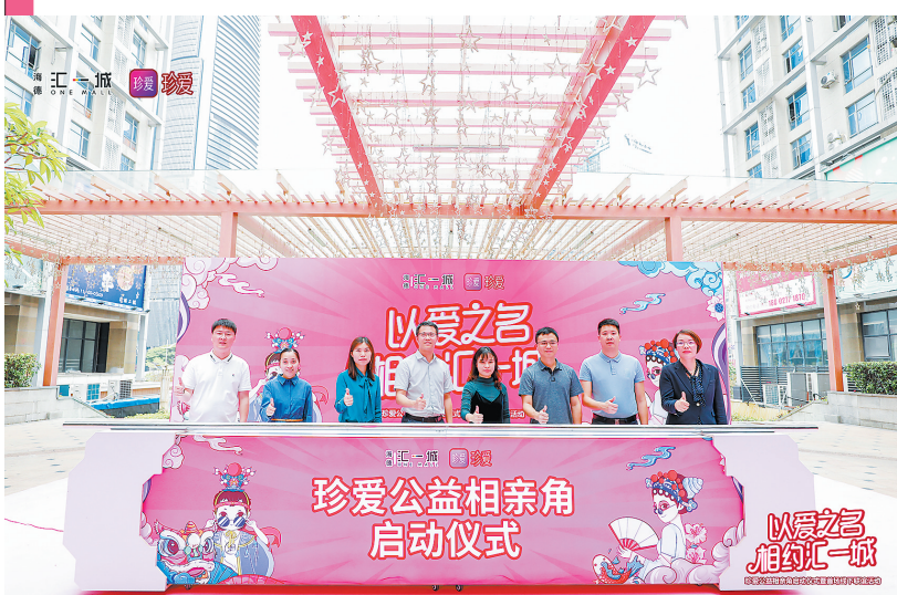
启动仪式暨“以爱之名·相约汇一城”活动现场