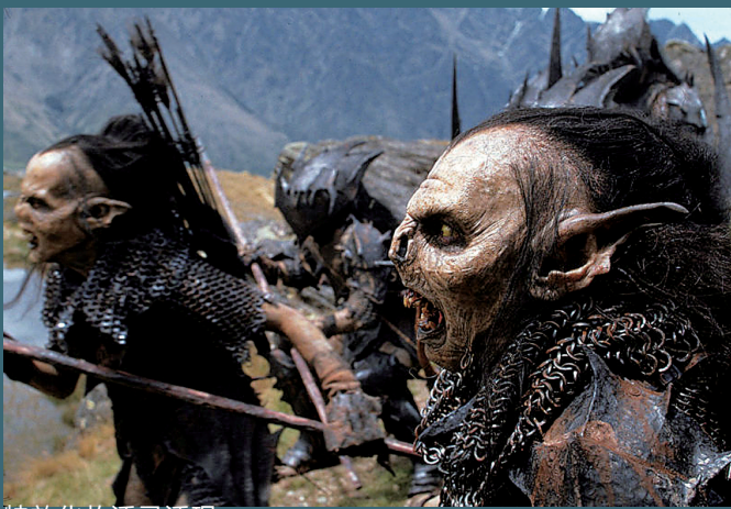
特效化妆活灵活现