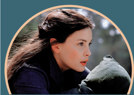
丽芙·泰勒饰演精灵公主