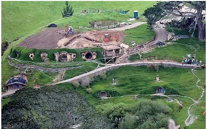
“霍比屯”成为新西兰网红景点