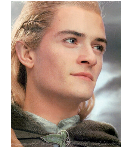
奥兰多·布鲁姆因饰演精灵王子而爆红