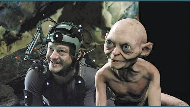
“动作专家”安迪·瑟金斯饰演咕嚕