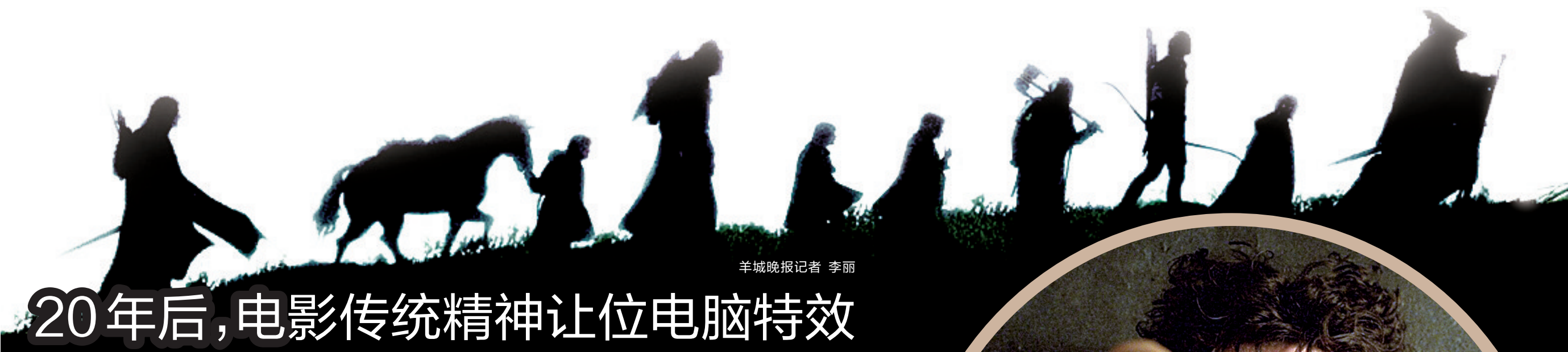
羊城晚报记者 李丽