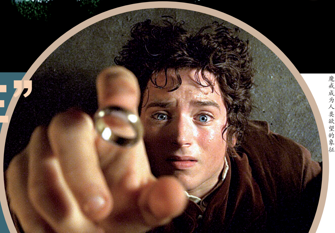
魔戒成为人类欲望的象征

上周五,已诞生20年的史诗魔幻系列电影《指环王》在中国内地正式开启重映。第一部《指环王:护戒使者》率先归来,但根据猫眼数据,该片重映首周末票房仅为2636.4万元。开局不利,本周五即将上映的《指环王2:双塔奇兵》以及尚未定档的《指环王3:王者无敌》也因此前途不明。作为全系列平均分高于9分的豆瓣高分作品,《指环王》在中国内地无疑仍拥有一大批粉丝。该系列最大的成就,在于其单凭想象力和传统电影手段,便打造出一个迄今难以超越的经典。在过度依赖电脑特效技术的当下,《指环王》及它所代表的电影传统精神似乎正在失落。