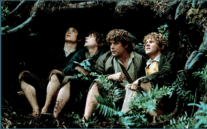
四个霍比特人小伙伴踏上冒险